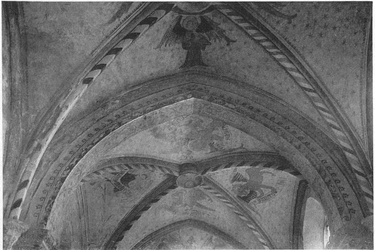
Kirche Büren a. A.: Chorgewölbe mit Malereien aus dem 15. Jahrhundert

Alte Bilddokumente überlieferten einen schlanken Turm mit Satteldach und Treppengiebeln. Der Zustand des Turmes hatte die Kirchengemeinde schon seit vielen Jahren beschäftigt und im Sommer 1963 begann die Ausführung eines Restaurierungsprojektes, das den Spitzhelm aus der Zeit von 1859 beseitigen und die alte Turmform wieder herstellen wollte.