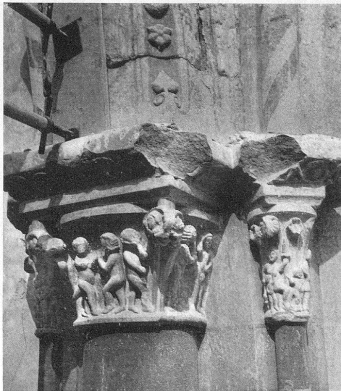
Spätromanisches Kapitell vor und nach dem Unglück