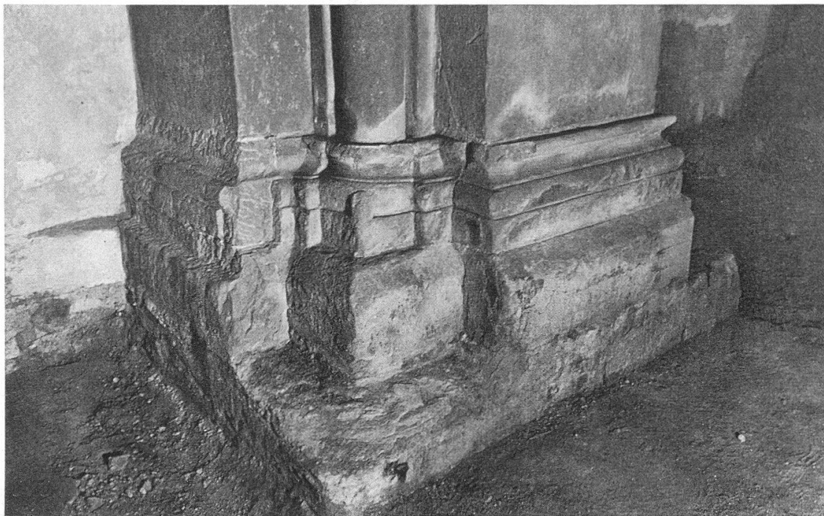
Kappel am Albis. Ehemalige Klosterkirche. Basis des nordwestlichen Vierungspfeilers vor der Restaurierung