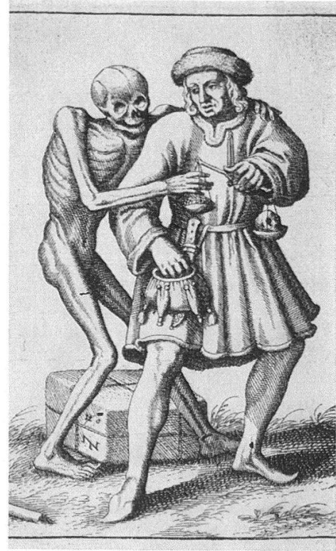
1 Bartholomäus-Tafel des Heilspiegelaltars von Konrad Witz, um 1435 und um 1440. – 2 Ausschnitte von Abb. rechts (Paketzeichen) und von Abb. links (Steinmetzzeichen, spiegelverkehrt). – 3 Tod und Kaufmann, Kupferstich von M. Merian (1621) nach dem 19. Paar des Basler Predigertotentanzes

scher und Holbeinischer Herkunft – vor allem das hektische Hopsen, das manierierte Tänzeln am Ort und die zusätzlichen Attribute – den vornehmlich in einer einzigen Ebene sich abwickelnden Bewegungsfluß noch nicht zerstückelt hatten. Von den authentischen Paaren erreichten einzig «Tod und Jungfrau» die Dichte der Kaufmannsgruppe. – Eine übergreifende Bedeutung mag auch für die Aussage der Mittelgruppe nachzuweisen, mag etwa von den lapidaren Zeilen «der nympt weder gelt noch gut» und «... hat mich umb lib und (leben) brocht» ausgegangen sein.