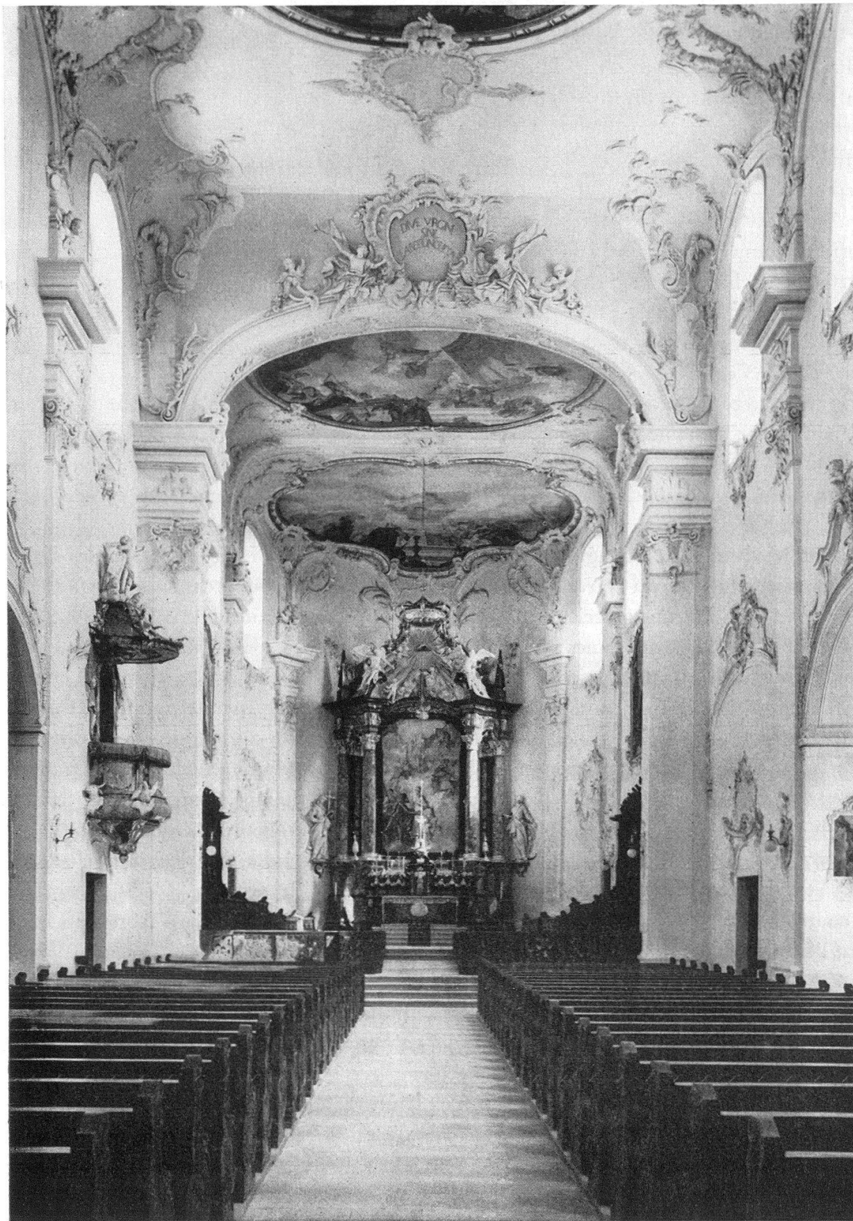
Domkirche von Arlesheim. Inneres, Blick gegen den Chor