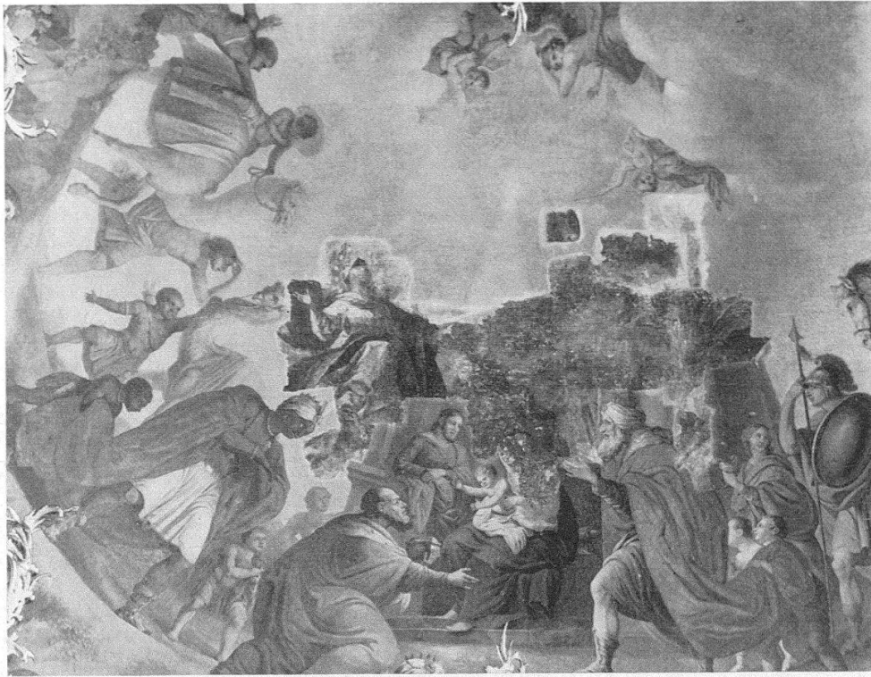
La cathédrale de Saint-Gall. Plafond du chœur avec «l'adoration des mages», peinture de Moretto (1818/21) déjà partiellement éliminée. On voit apparaître l'œuvre originale de Wannemacher, achevée 1766: «laudent nomen eius in choro»