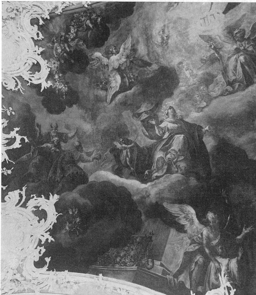
La cathédrale de Saint-Gall. La même partie après le dégagement et après les retouches: La vierge et saint Benoît adorent le nom de Iavéh

coupole principale, fort endommagée, subit les premiers repeints d'Antoni Dick, en 1773 déjà, et les seconds en même temps que les voûtes de la nef par Moretto, en 1819. La dernière et la plus grave atteinte est l'œuvre de Franz Bertle, effectuée en 1866 et 1867 dans la rotonde et dans la nef. Un fond de ciel bleu, nuageux et peuplé de figures rappelant une décalcomanie douceâtre, remplace le noble clair-obscur de Wannemacher. En ce qui concerne le chœur, Moretto fit couvrir la couche primitive, de 1818 à 1821; il changea le programme iconographique en imposant ses propres créations, une pâle réplique de l'école des Nazaréens. La peinture originale du plafond était-elle restée intacte? Était-elle abîmée par les couches ultérieures si médiocres? Le résultat du dégagement a dépassé toutes nos espérances, malgré une stratification très compliquée. Wannemacher avait peint à la détrempe sur un fond rouge de bol d'Arménie; Moretto avait posé ses couleurs