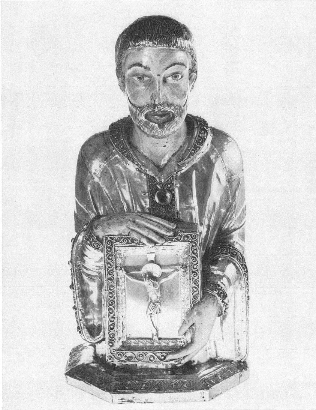
Buste de saint Bernard, du trésor du Grand-Saint-Bernard (h. 50 cm), vers 1200