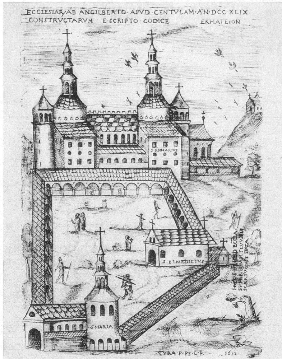
Die Abtei Centula-Saint-Riquier in der Picardie. Kupferstich von 1612 nach einer alten Miniatur

hl. Germanus in Auxerre eine Krypta bauen wollte, wurde ein Modell aus Wachs angefertigt, damit man sich über die künftige Gestalt der Anlage einen Begriff verschaffen könne: «concepti operis exemplar conficitur, et quasi quodam praeludio futurae moles magnitudinis caeris brevibus informatur» (Schlosser, a. a. O., S. 193). Wie ähnlich tönt das «caeris brevibus» dem «paucis exemplatum» des Klosterplans! Vor allem ist das Modell von Auxerre keine Kopie – das hätte in diesem Zusammenhang keinen Sinn – sondern eine Vorlage. Das Bedeutsame bei der Übersendung des Plans an Abt Gozbert war gewiß ebenfalls nicht, daß er ein weiteres Exemplar einer Zeichnung, sondern ein Exempel, ein Beispiel für die Klosteranlage, erhielt.