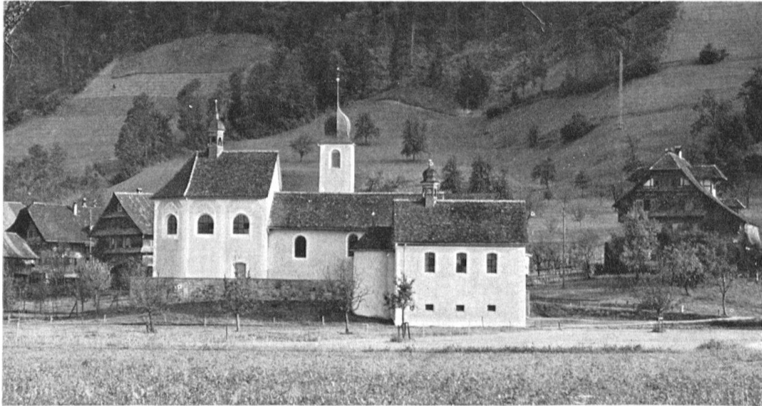
Blatten, St. Jost . Gesamtansicht der Wallfahrtskirche von Norden, rechts außen Kaplanei