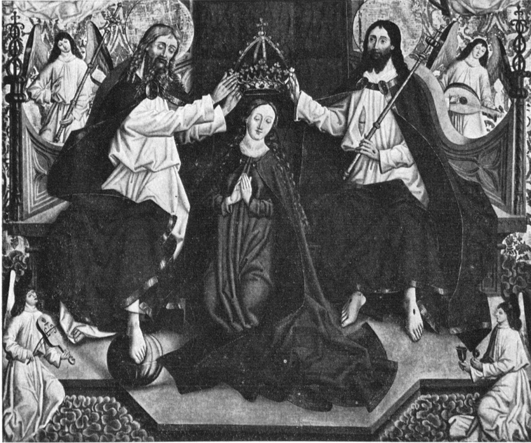
Engelberg, Klostermuseum. Marienkrönung, Altartafel. 1480–1490