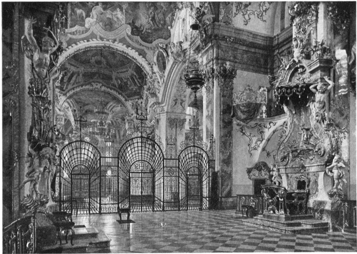
Einsiedeln. Klosterkirche. Inneres, 1719–1726 von Caspar Moosbrugger