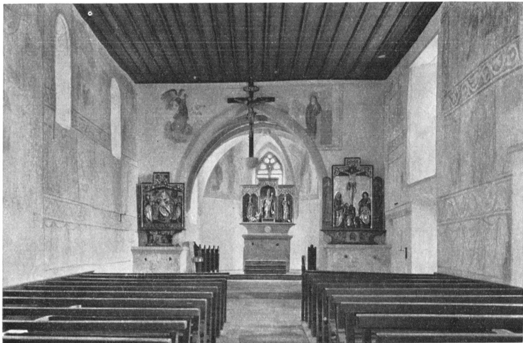
Sempach. St. Martin auf Kirchbühl. Inneres mit Blick gegen den Chor