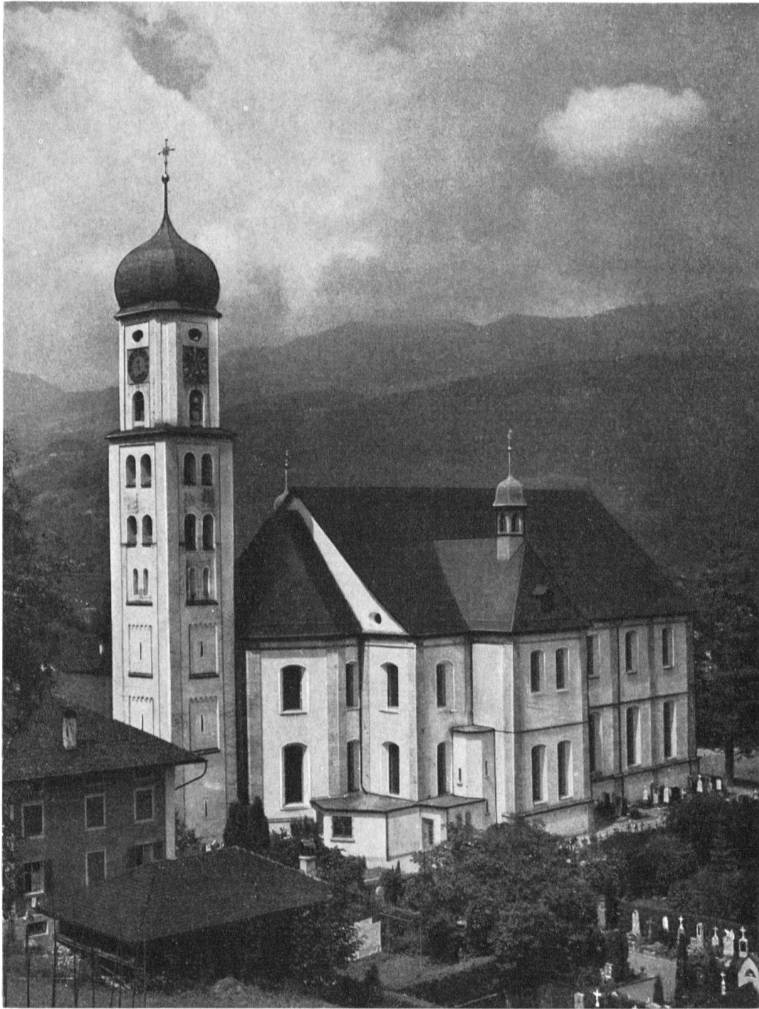
Sachseln. Pfarr- und Wallfahrtskirche. Ansicht von Südwesten