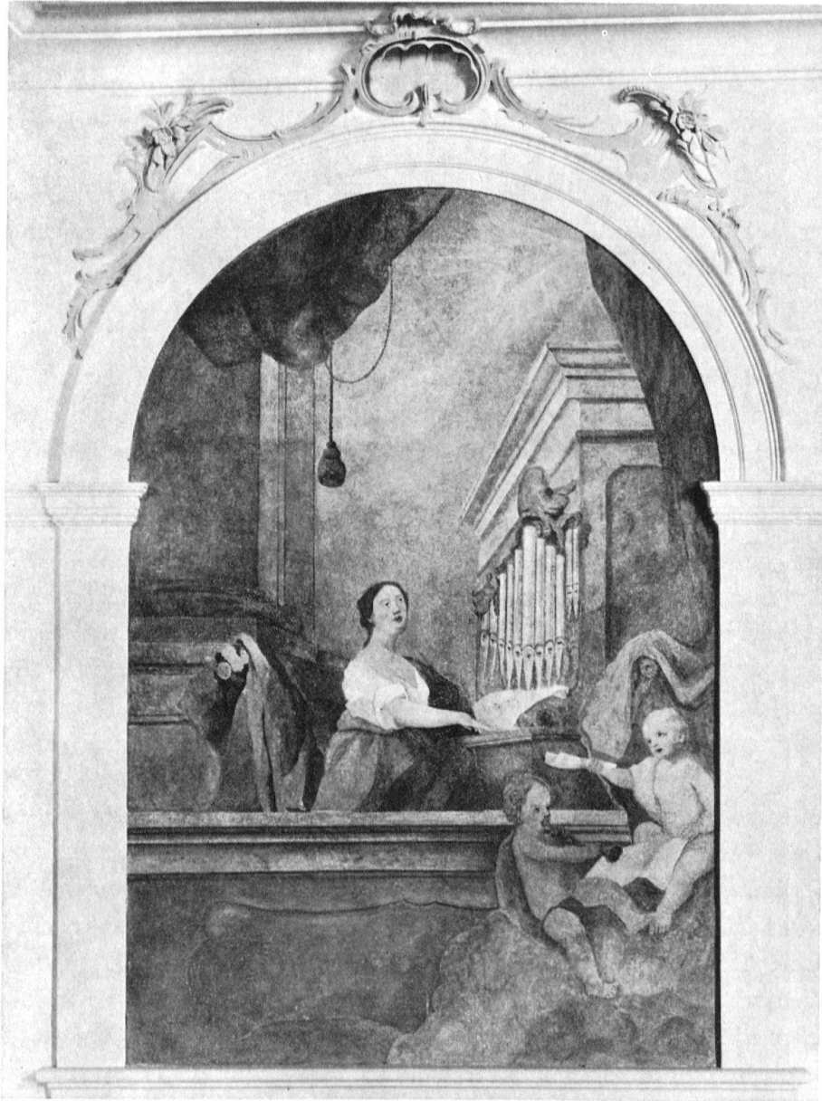
Schwyz. Pfarrkirche. Fresko von Conrad Wenger, 1772, an der linken Chorseite. 1964 aufgedeckt

vierten Partien ist auch für den Laien leicht ablesbar. Die Wände strahlen in reinem Weiß, auch die Pfeiler samt den Kapitellen, die von den schweren Goldauflagen befreit wurden. Auch der Stuck hat die Goldauflagen abgeschüttelt, er ist gegen die weiße Decke grau abgetönt und wirkt wie eine feine Filigranstickerei. Die vergoldeten Tapetenmuster in den Gewölbegurten, die schwer und drückend lasteten, sind verschwunden. Mit eleganter Leichtigkeit schwingen die Kuppelbogen einander entgegen. Die Deckenbilder im Chor, im Kuppelraum und im Querschiff wurden von Staub und Ruß befreit. Die stumpf gewordenen Farben leuchten wieder, wenn auch gedämpft. Am besten ist die farbliche Erneuerung am herrlichen Weihnachtsbild der Kuppel abzulesen.