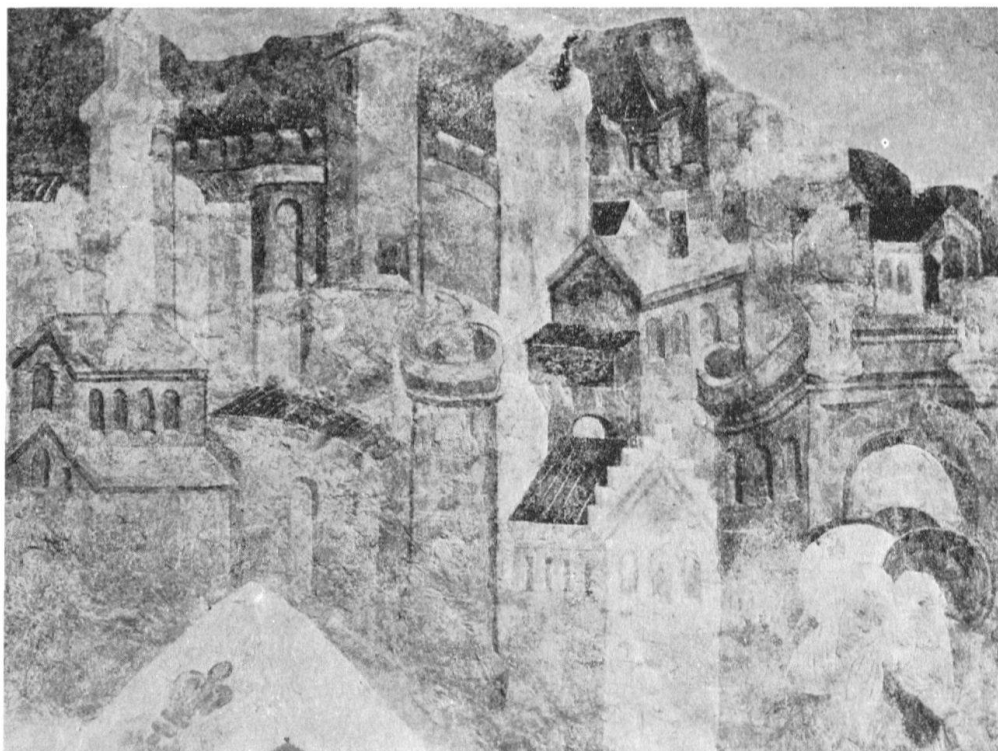
Scherzligen, Kirchenschiff, Nordwand: Stadtbild mit Maria und Johannes auf dem Heimweg von der Grablegung (Johannes XIX, 27). Gegenwärtiger Zustand

Daß der Glasmaler Peter für Thun gearbeitet hat, steht somit fest. Leider sind diese Fenster verloren gegangen, vielleicht schon 1738 beim Neubau des Kirchenschiffs. Doch wie die Mahnung des Berner Rates an die Thuner die Verbindung zwischen «Peter