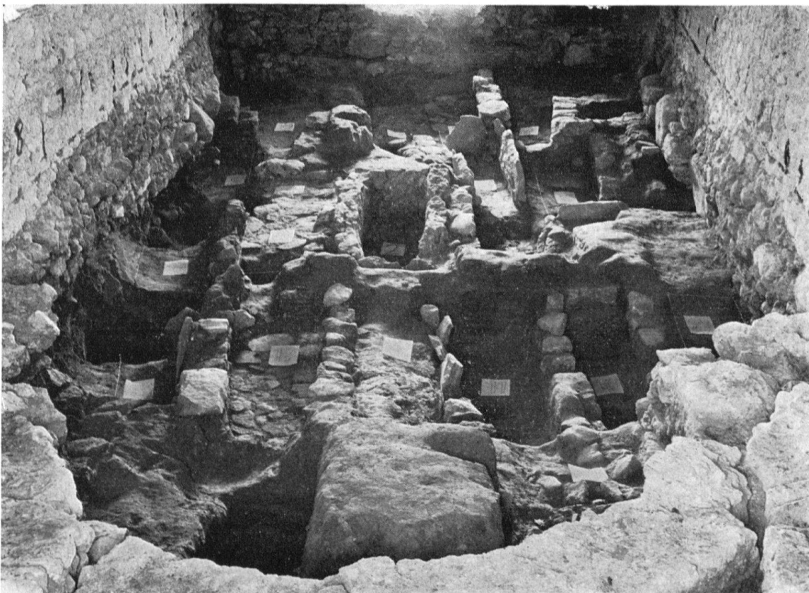
Aufnahme der Ausgrabungen mit Blick gegen Westen

IV. Als das kleine, schmale Chörlein zu eng wurde, ersetzte man es durch das heute noch bestehende, mit Spitztonne gewölbte Chor mit zwei (oder drei?) rundbogigen Fenstern nach Osten und zwei Fenstern nach Süden. Eine der beiden Nischen in der Nordmauer diente als Sakramentshäuschen. Nach der Form der beiden Ostfenster – breit geschrägtes Gewände, schmaler Lichtschlitz mit gotischen «Nasen» am oberen Abschluß – und nach der Ausmalung des Fenstergewändes dürfte der Chor Neubau aus dem