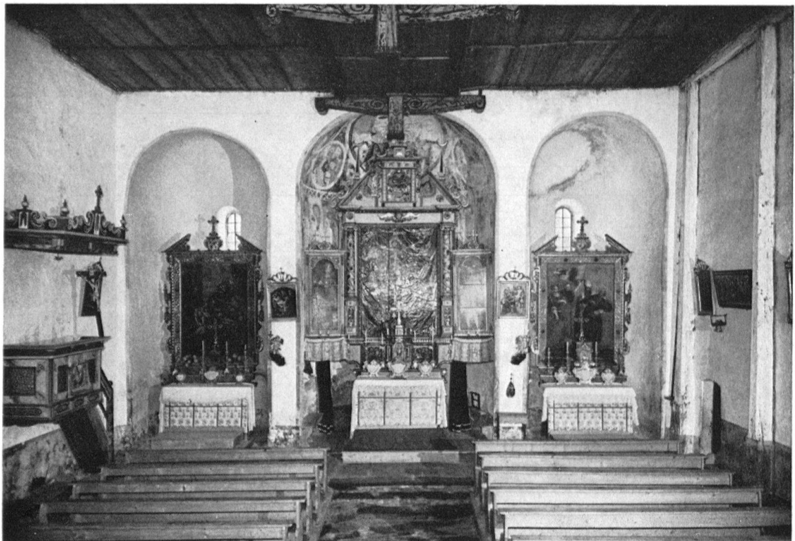
St. Peter in Mistail, Kanton Graubünden. Ansicht des Innern gegen Osten, jetziger Zustand

Auch wenn die einzelnen Kirchenbauten zum Teil hypothetisch bleiben, ergibt sich ein farbiges Bild von der weit hinaufreichenden Geschichte der Dorfkirche von Démoret. Die Mauritiuskirche gehört zu den ältesten Pfarrkirchen der Gegend. HR. Sennhauser