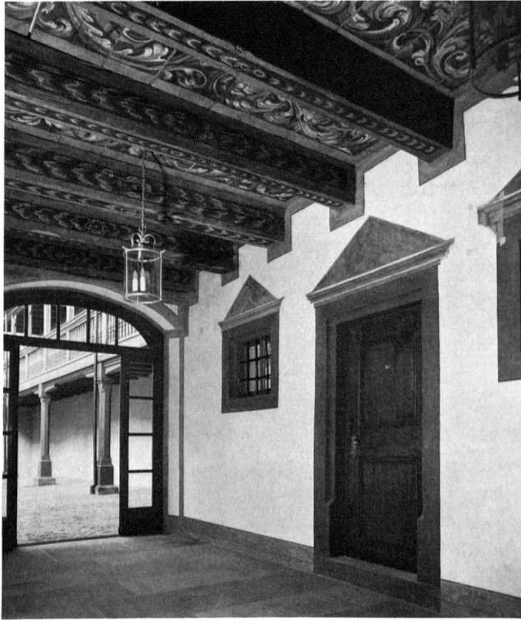
Basel, Nadelberg 10, «Zerkindenhof». Durchgangshalle im Querflügel mit frühbarocken Dekorationsmalereien

Bruchsteingemäuer und kräftig abgebundene Holzkonstruktionen des Bauwerks müssen demnach mindestens im Bereich des doppelgeschossigen Kellers und des ganzen Parterres dem Erdbeben von 1356 standgehalten haben.