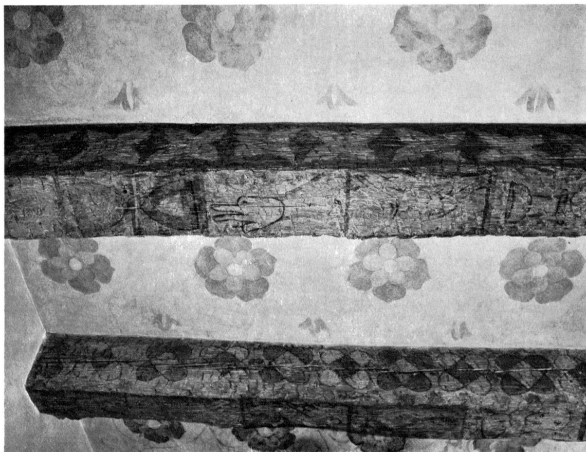
Basel, Nadelberg 10, «Zerkindenhof». Bemalte Decke im Erdgeschoßsaal des Hoflängstraktes. Erste Hälfte 14. Jh.

Der halbscheidig an der Südgrenze stehende Längstrakt im Hof – anfänglich mit einem spiegelgleichen Gegenstück auf der Nachbarparzelle als Doppelwohnhaus errichtet – bildete die eigentliche Heimstätte des erwähnten Edelmannes und seiner Gattin und stellt das Kernstück der Liegenschaft dar. An der Decke im hinteren Teil des Erdgeschoßsaales konnte anlässlich der kürzlich vollzogenen Restaurierung die älteste bisher bekannte Profanmalerei Basels freigelegt und aufgefrischt werden. Alle Untersichten des – nachmals zur Haftung von Mörtelhüllen mit Beilhieben aufgehickten und jetzt mit Spezialleim an den Sichtflächen glattgeklebten – Holzgebälks zeigen auf stets wechselnden braunrot-, grau- und hellbeigegegründig gefärbten Abschnitten mit dunklen Konturen zügig aufgemalte figürliche Motive in unerschöpflichen Abwandlungen. An den Seitenwangen der Balken ziehen auf naturbelassenem Holz mit dem Pinsel in ähnlich spon-