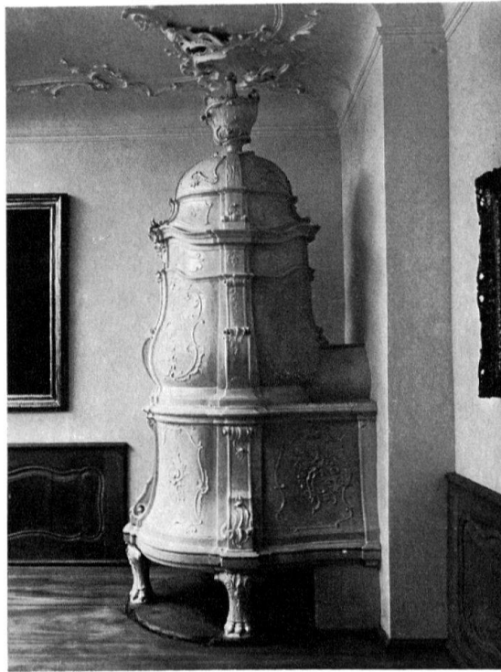
Basel, Nadelberg 10, «Zerkindenhof». Rokokosalon von 1758 in der ersten Etage des Vorderhauses