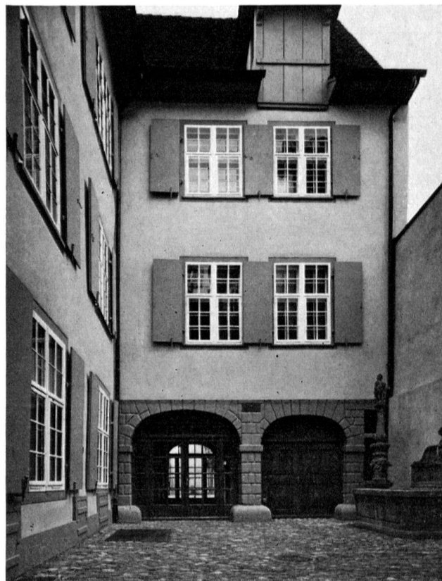
Basel, Nadelberg 10, «Zerkindenhof». Innenhof mit Längstrakt, Quertrakt und Ceres-Brunnen um 1590