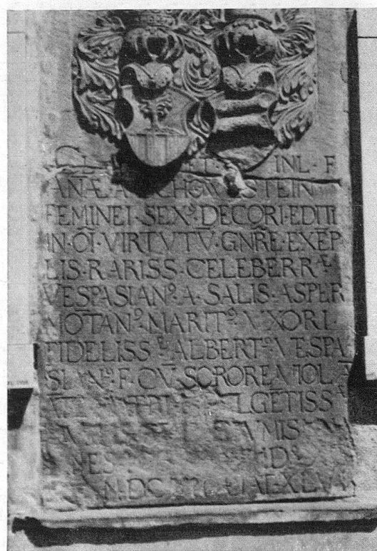
Epitaph Salis-Schauenstein an der Kirche Jenins aus einem Kalkschiefer, entsprechend Scalärastein, datiert 1612. Heutiger Zustand, gegenüber dem vor etwa 30 Jahren fast unverändert (siehe Text). Die Beschädigungen des rechten Wappens und der horizontale Riß oben beruhen nicht auf Grundfeuchtwirkung, sondern auf einer alten Beschädigung der Platte (schon vorhanden in der zitierten Abbildung in den Kdm.)