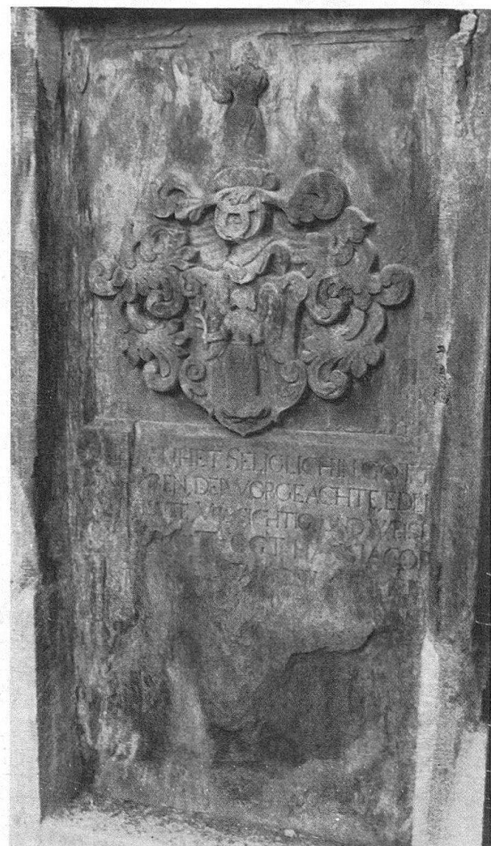
Links: Grabtafel Nr. 48 (vom Eingang gezählt) aus Scalärastein im Scalettafriedhof in Chur, datiert 1688. Aufnahme 1936, bereits erhebliche Schäden zeigend. Die Einfassung im Grundfeuchtebereich ist in Zementmörtel erneuert. Rechts: Aufnahme der gleichen Tafel im Herbst 1966. Große Ausdehnung der Zerstörung, auch oben. Die Einfassung in Mörtel ergab keinen Schutz

unleserlich), demonstrieren uns eindrücklich den ungünstigen Einfluß der Untergrundes der Örtlichkeit, verstärkt durch die Lage des Friedhofes in der schwefelsäurereichen Stadtluft. Dazu kommt die besonders bei dieser geschieferten Gesteinsart ganz ungünstige Stellung des Steines «auf dem Spalt», was bei vertikalen Platten natürlich unvermeidlich war. Der Verfasser nahm vor etwa 30 Jahren verschiedene dieser Platten mit noch relativ geringen Schäden im untern Bereich auf, und dann wieder im vergangenen Herbst. Die Abbildungen 1 bis 4 geben zwei Beispiele, die kaum eines Kommentars bedürfen.