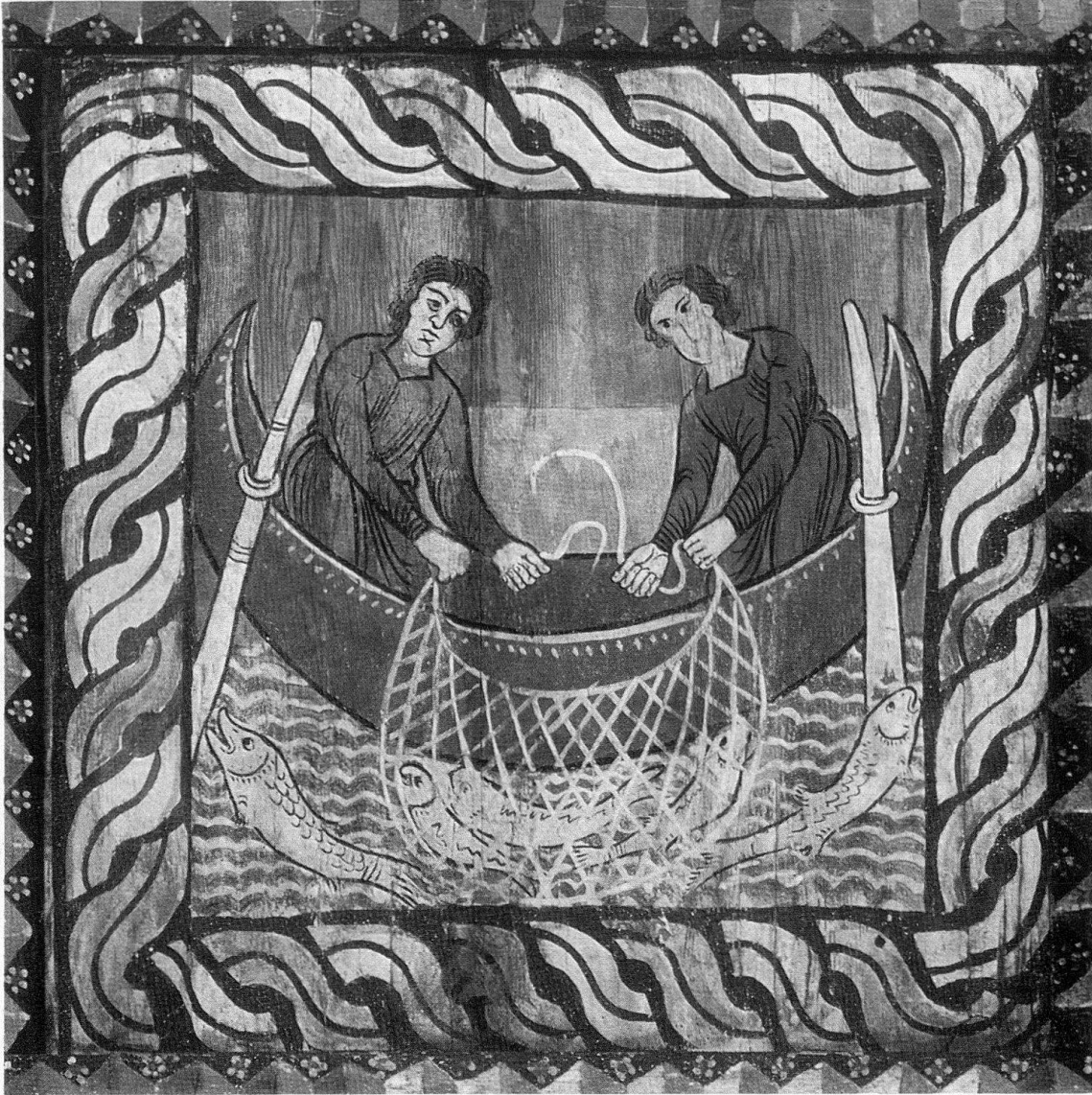
Zillis, Kirche. Romanisches Deckenbild Nr. 10 mit Fischzug

Siebenzahlen zum Aufbau der Welt über, führt vom Makrokosmos (Himmel, Planeten, Sonnen) über die Wochentage zum Mikrokosmos des menschlichen Lebens und schließt mit einer verwirrenden Fülle von Siebenzahlen. Bei diesen Verdichtungen wird das metrische Maß – das gleichsam dem Leistensystem in Zillis entsprechen würde – auf die Zahl 7 abgestimmt. Somit stehen diese Dokumente aus der Zeit um die Mitte des 12. Jhs. der Decke von Zillis geistesgeschichtlich nahe. Wenn Markus Jenny in seinem Aufsatz «Unter dem Siegeszeichen des Kreuzes» 7 mit Recht die Frage stellt, ob innerhalb der Heilsgeschichte des inneren Zyklus ursprünglich eine veränderte und straffere Gruppierung der Bilderfolgen bestand (die jetzige geht auf eine Neuordnung nach Angaben von Poeschel zurück), dann müßte man wohl auch der zahlenmäßigen Ordnung mehr Beachtung schenken.