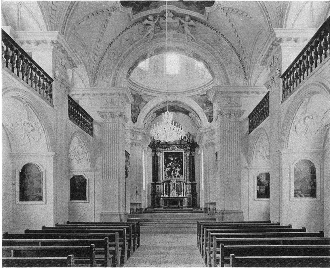
Die renovierte Klosterkirche St. Lazarus in Seedorf, erbaut 1696–1699 durch den Einsiedler Klosterarchitekten Br. Caspar Mosbrugger

selbdritt in schöner Weise ihren Standort gefunden hat. Der Bauherr hat sich in der Oberkirche durch ein monumentales Epitaph aus Sandstein verewigt, darauf rückwärts geschrieben steht: «Hie richt Gott nach dem Rechten, die Herren liegent by den Knechten».