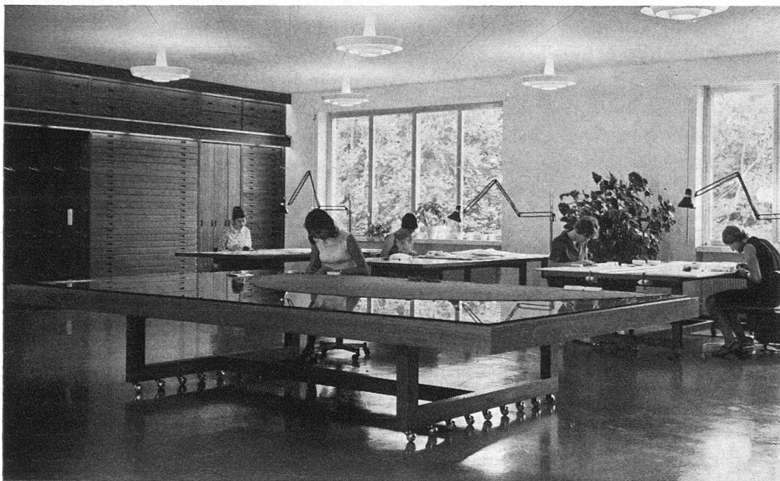
Abegg-Stiftung Bern. Textilrestauration mit Depotschrankwand