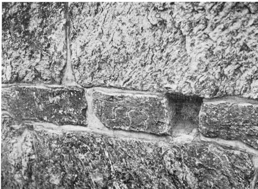
Detailbild des Cipollinmauerwerks der Nordseite. Die großen Quader (oben und unten) stehen «auf dem Spalt», d. h. die ursprünglich grüne Bänderung im weißen Marmor wurde senkrecht gestellt. Im kleinen Gerüstloch ist Kalktuff (Füllmauer) sichtbar. Die Jahreszahl im kleinen Quader ist nicht deutbar.

Auch der Mauerverband zeigt eine Besonderheit. Einige Teile der Nordseite (Abb. s. unten) weisen einen Wechsel von schmalen und breiten Steinen auf, wie er im alpinen Gebiet zum Beispiel an der etwa gleichaltrigen Kirche San Nicolao in Giornico festzustellen ist. Während aber in Giornico zumindest große Teile des Bauwerks diese offensichtliche Zieranordnung zeigen, blieb sie in Zillis in den Anfängen stecken. Die ungleiche Höhe der Lagen ist in Zillis wie in Giornico durch abwechselndes lagerhaftes Versetzen und «auf den Spalt stellen» der gleichen Steinart in plattiger Quaderform erzeugt 8 . Die schmalen Schichten sollten wohl im wesentlichen die Funktionen von Bindern übernehmen. Mit diesem Wechsel (in der breite oder schmale Lagen auch verdoppelt sein können) bezweckte man ein charakteristisches Streifenbild, das heute durch die genannte Altersverfärbung erheblich verwischt ist. Offenbar regte der gut zerlegbare Cipollinfindling zu diesem Mauerwerkstyp an. Bald wurde erkannt, daß das wohl nur beschränkt zur Verfügung stehende Material sich auf diese Weise nicht rationell verwerten ließ und man ging zu unregelmäßigerem, vorwiegend dünnlagigerem Schichtenmauerwerk über