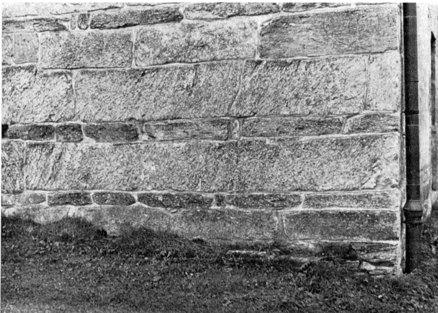
Mauerpartie an der NW-Ecke des Schiffes, mit dem Wechsel von breiten und schmalen Steinen. Der untere breite Quader ist 3,7 m lang. Fast alle Steine sind Cipolline (Ausnahme: der dunklere große Quader rechts oben besteht aus einer andern Marmorart)