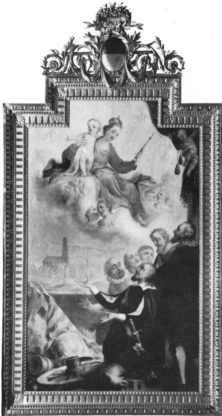
Fribourg, St-Nicolas. Retable de Notre-Dame des Victoires