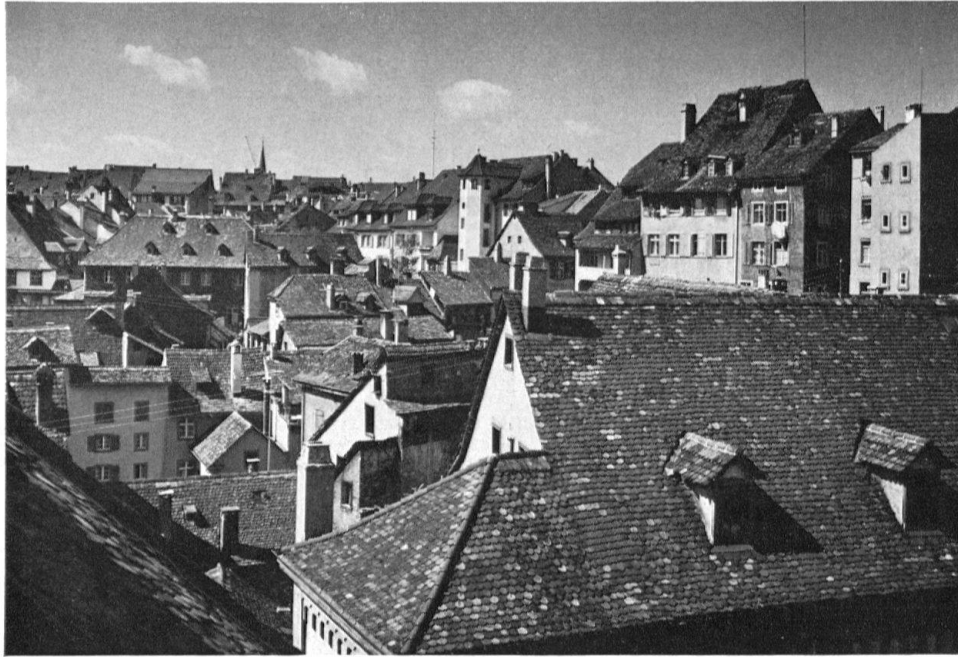
Blick auf eine Kernzone der Basler Altstadt: Andreas-Platz, Imbergäßlein und rechts oben Nadelberg-Häuser

Wohngemaches freigelegt und restauriert werden – grüne Rankendecke und reich gestaltete Türdekorationen –, welche offensichtlich Bürgermeister Wettstein als seinerzeitiger Besitzer hat anbringen lassen.