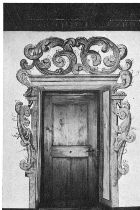
Riehen, Lüscherhaus. Eingangshalle. Gemalte Türumrahmung vor und nach der Restaurierung