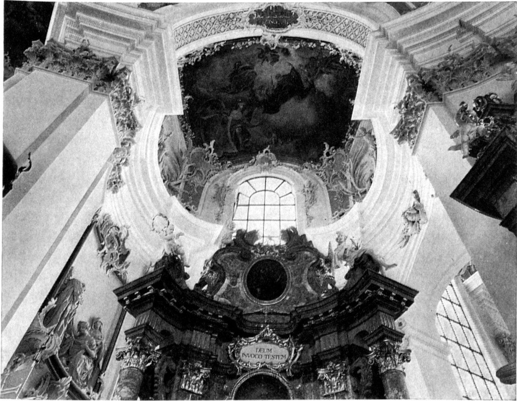
Kathedrale St. Gallen. Blick in ein Joch der Rotunde