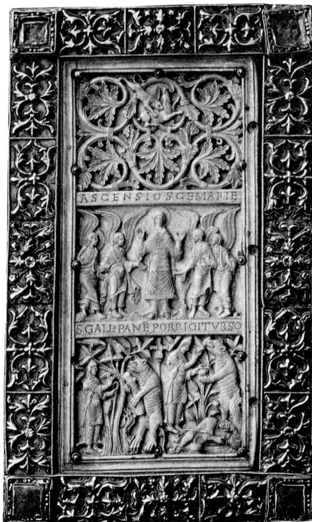
Elfenbeintafel II am Evangelium Longum (Himmelsaufnahme Mariens, St. Gallus und der Bär). Geschnitzt von Tutilo um 890

Noch besitzen wir als bildungsgeschichtliche Quelle den Katalog der Stiftsbibliothek (Cod. 728) aus den Jahren 850–880, der schon damals die beträchtliche Anzahl von vierhundert Bänden inventarisierte 23 . Von vielen Schreibern blieben uns in solchen Manu-