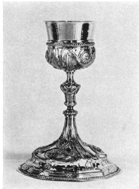
Kirche Wald (ZH). Monstranz, 18. Jh. - Louis-XVI.-Kelch