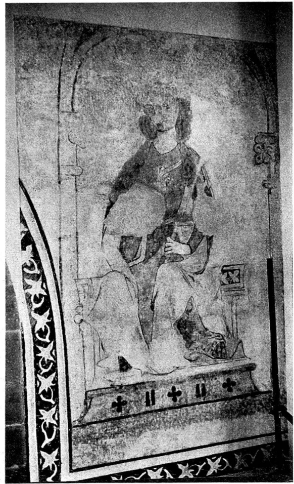
Abb. 4. Konstanz. Insel-Hotel, ehemalige Dominikanerkirche. Fresko an der Westwand, oberer Teil, nördliche Hälfte: Sitzende Figur mit Szepter. Zustand nach der Restaurierung

der Freilegung in Abbildungen gezeigt 9 (Höhe des ganzen Bildes: 4,20 m, Davids: 2,70 m). Nach Entfernen der Reste der zum Schutz stehengelassenen barocken Tüncheschicht, Vorfixieren mit Silikat und Reinigen mit destilliertem Wasser, Einputzen der großen, durch Balken eingestoßenen Löcher und zahlreicher Pickelhiebe und ihrer Eintönung mit Silikatfarbe ist das Bild viel heller, klarer und farbig intensiver geworden. Allerdings hat sich nach Entfernen von Mörtelresten des Verputzes des ausgehenden 19. Jhs. der Ausdruck der Augen sehr verändert (Abb. 1).