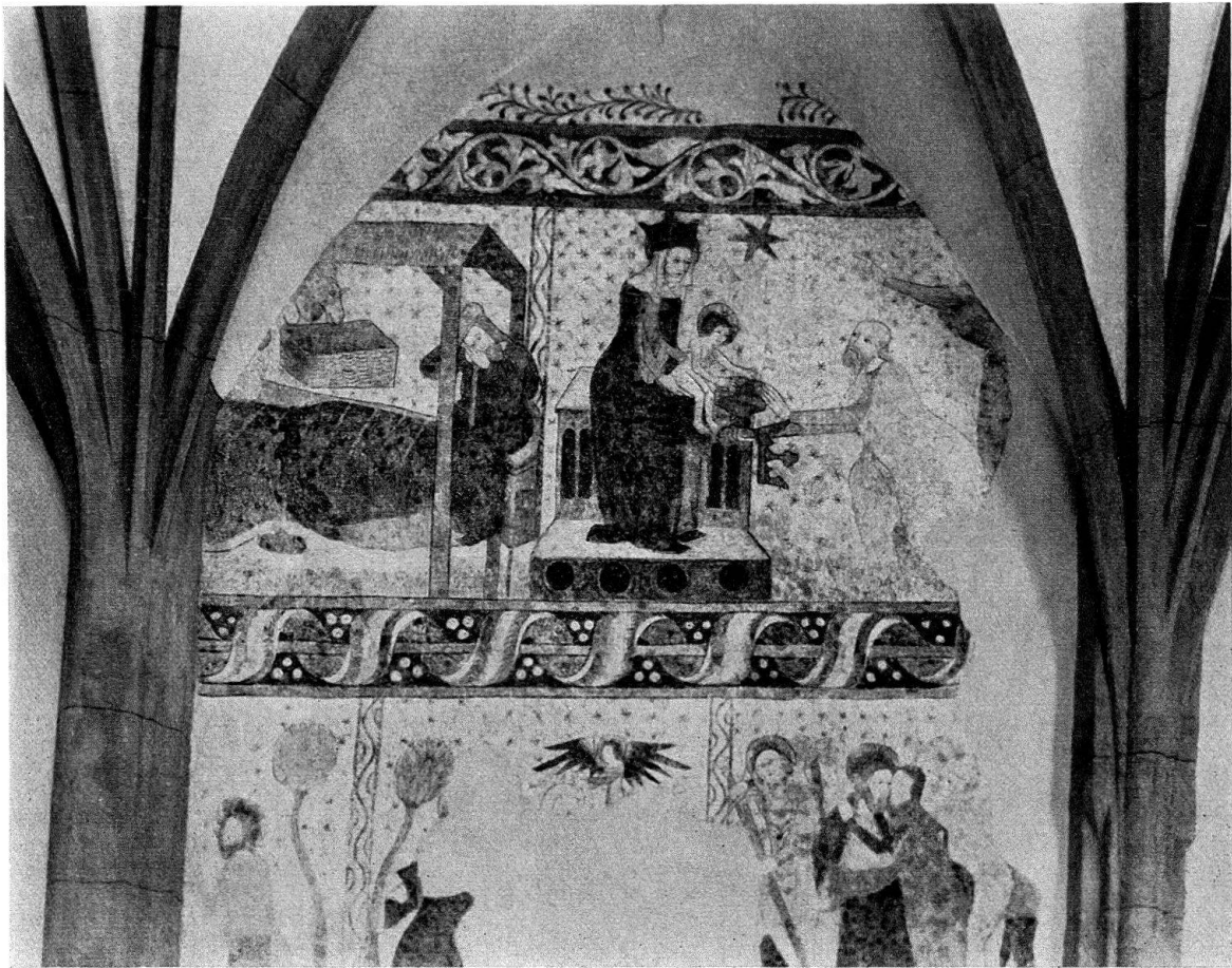
Abb. 3. Salouf, St. Georg, 1. Joch. Geburt und Huldigung, Fußwaschung, Ölberg und Gefangennahme