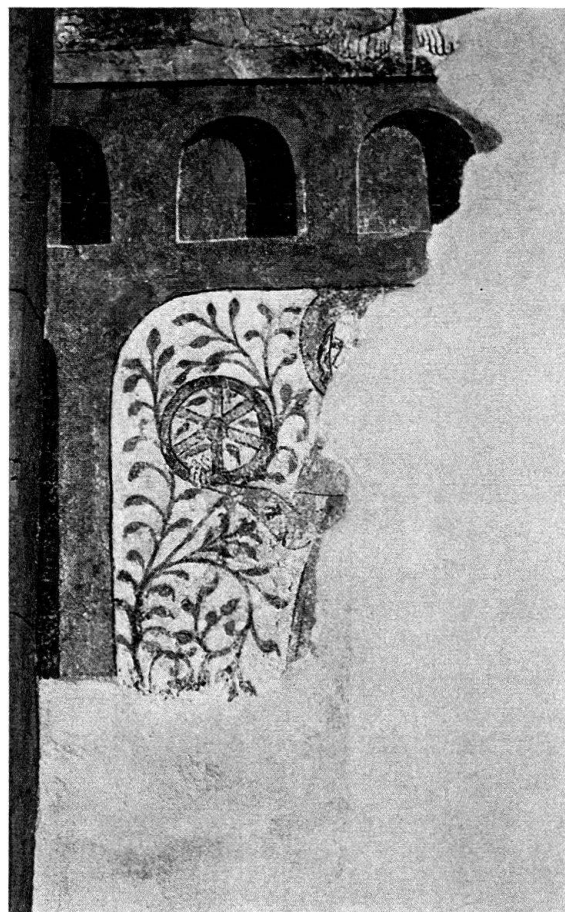
Abb. 2. Salouf, St. Georg. Hl. Katharina

Unter den Arkaden stehen vor einem Rankengrund im ersten Joch Katharina mit dem Rad, im zweiten ein heiliger Bischof und Johannes der Täufer mit einem Buch, der an seinem Fellkleid zu erkennen ist.