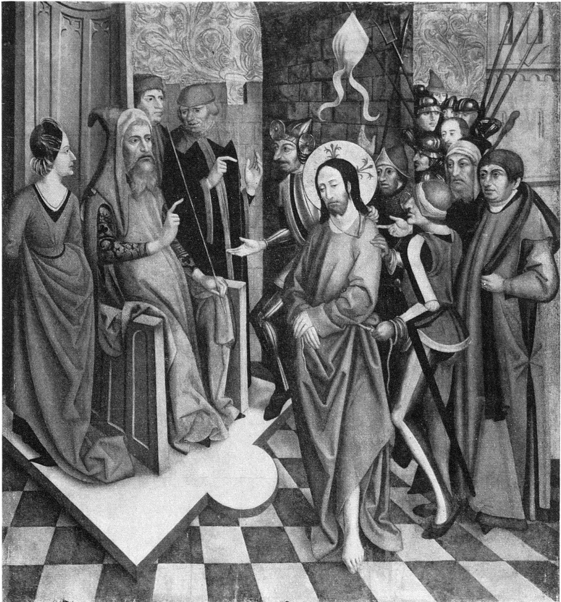
Abb. 5. Christus vor Pilatus, Holz, 137 × 126 cm, Augustinermuseum Freiburg i. Br.

Austreibung der Teufel und die Vertreibung Christi aus dem Tempel; rechts innen die Taufe Christi und das Martyrium des Evangelisten Johannes, außen das kanaanäische Weib, die Speisung der Fünftausend und der Einzug in Jerusalem (Bischöflicher Besitz St. Gallen)