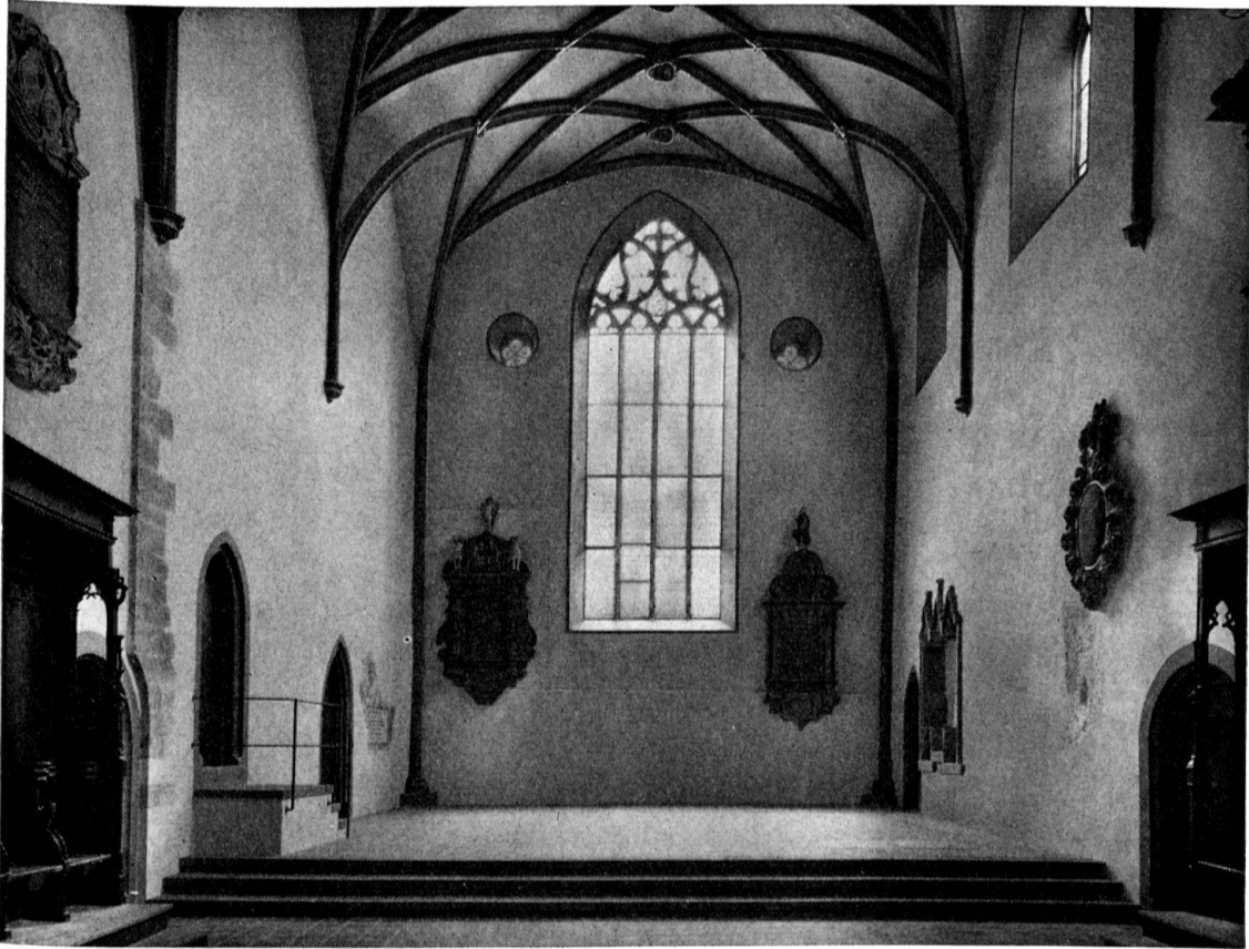
Basel, Peterskirche. Inneres des Chors von Westen her

schnitt. Grundrißakkumulationen auf einem einzigen Blatt konnten dem gotischen Baumeister schwindelnde Höhen erschließen 5 . Man könnte sich sogar fragen, ob nicht mit dieser Gepflogenheit einzelne der in den Fußboden eingelegten Labyrinth (an sich ein antikes Bodenschmuck-Motiv) zu tun haben, trugen sie doch in frühgotischen Kathedralen der französischen Kernlande mitunter die Bildnisse des oder der Architekten zur Schau. Mögen die Baumeister sich auch nicht explicite als Theseus' Nachfolger in dem Sinne verstanden haben, daß sie allein den Grundriß des ringsum sich erhebenden Gebäudes zu entwirren, das heißt zu lesen vermochten, so könnten sie sich doch in Anlehnung an das Labyrinth als eines Sinnbildes für die irdischen Irrwege, die nur den unverdrossenen Gläubigen schließlich in die «ecclesia» (Inchrift in der Mitte eines frühchristlichen Labyrinths in Orléansville) einlassen, als Wegweiser oder -bereiter gesehen haben, was unseren Überlegungen ebenso, wenn nicht besser entspricht.