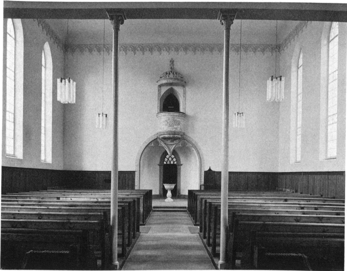
Ref. Pfarrkirche Berlingen. Ostwand mit Kanzel und Taufstein