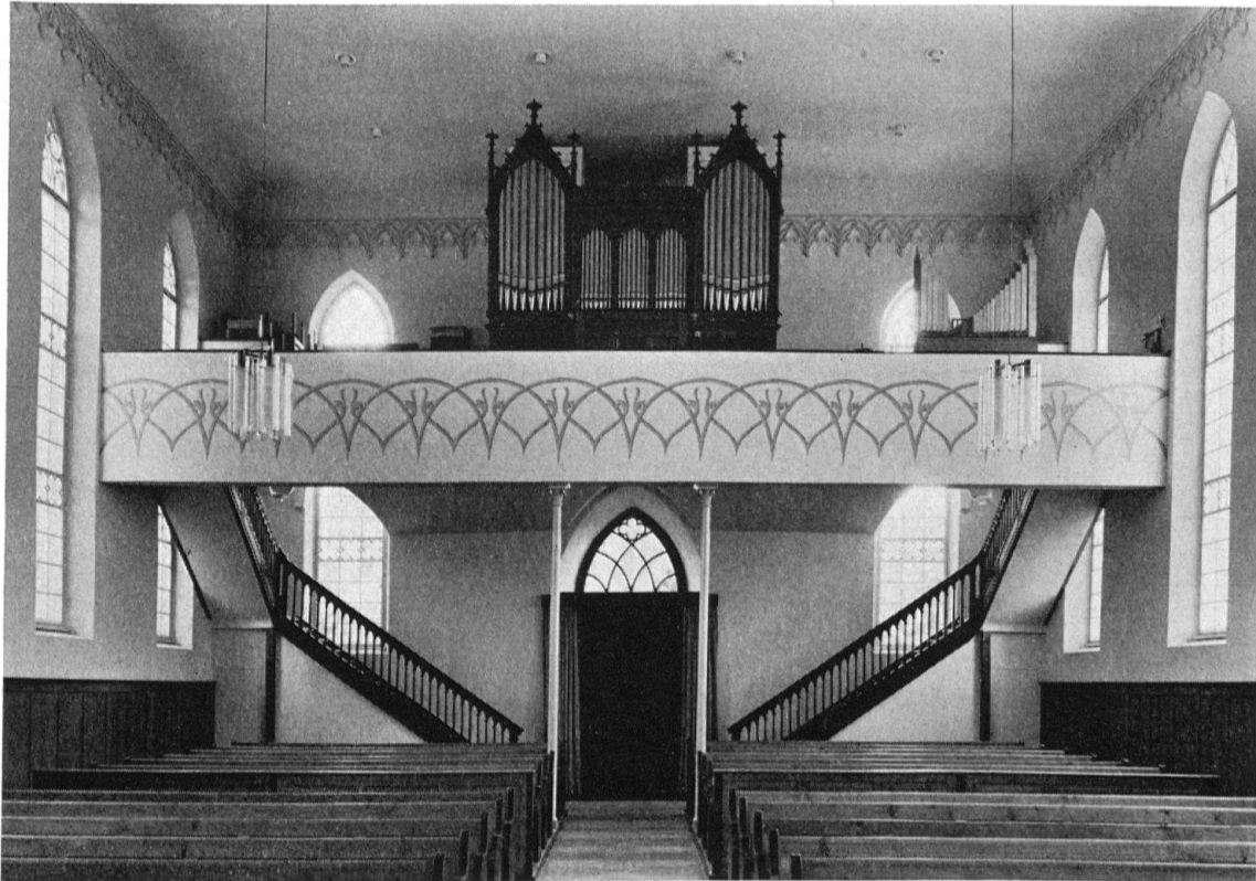
Ref. Pfarrkirche Berlingen. Westempore und neugotischer Orgelprospekt

sondern glaubte an einen neu zu schaffenden Stil, der unter der Führung des einen die Vorzüge und Schönheiten der andern miteinzubeziehen versuchen müsse. Ein typisches Beispiel bietet der neugotische Umbau von St. Laurenzen in St. Gallen (1849–1855). Als der geniale Ersteller der Umbaupläne, Johann Georg Müller, starb, wählte der Zürcher Architekt Stadler, den Turmhelm im Sinne reiner Gotik abändern zu müssen, weil Müllers «Gotik» sich noch anderer, außergotischer Motive habe bedienen wollen.