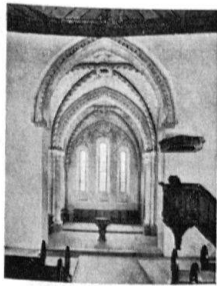
Pfarrkirche Büren a. A.