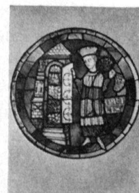
La Rose, Cathédrale Lausanne