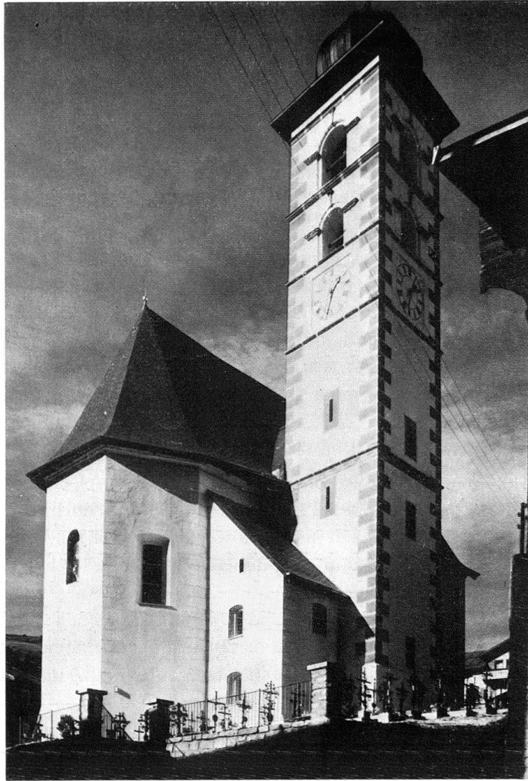
Lumbrin. Pfarrkirche St. Martin, Südost-Ecke

Diese einfache Überlegung wagte man anfänglich nicht laut zu äußern, denn die Preisgabe der Empore war mit einem erheblichen Platzverlust verbunden. Wo sollte die Orgel, wo die Sänger Platz finden und wo jene Kirchgänger, um derentwillen ja die Empore besser ausgebaut werden sollte? Ein ganz ungewohnter, schockierender Projekt-Vorschlag gab Antwort auf diese Fragen. Er sah den Ausbau einer Loggia im Chor über der Sakristei für die Orgel vor, die Plazierung der Sänger im Chor und schließlich den Verzicht auf Kniebänke, um mehr Sitzplätze im Schiff zu gewinnen. Der Vorschlag erforderte nur einen kleinen Eingriff in die bauliche Substanz, den Teilausbruch der ersten Chorjochwand und die Anlehnung des Sakristeidaches an den Chor statt an den Turm. Aber er verlangte von den Sängern eine ungewohnte Präsentation ihrer aktiven Anteilnahme, von der Jungmannschaft den Verlust eines traditionellen Vorrechtes und von der Gemeinde die Aufgabe einer althergebrachten Form des Gottesdienstes. Schritt um Schritt