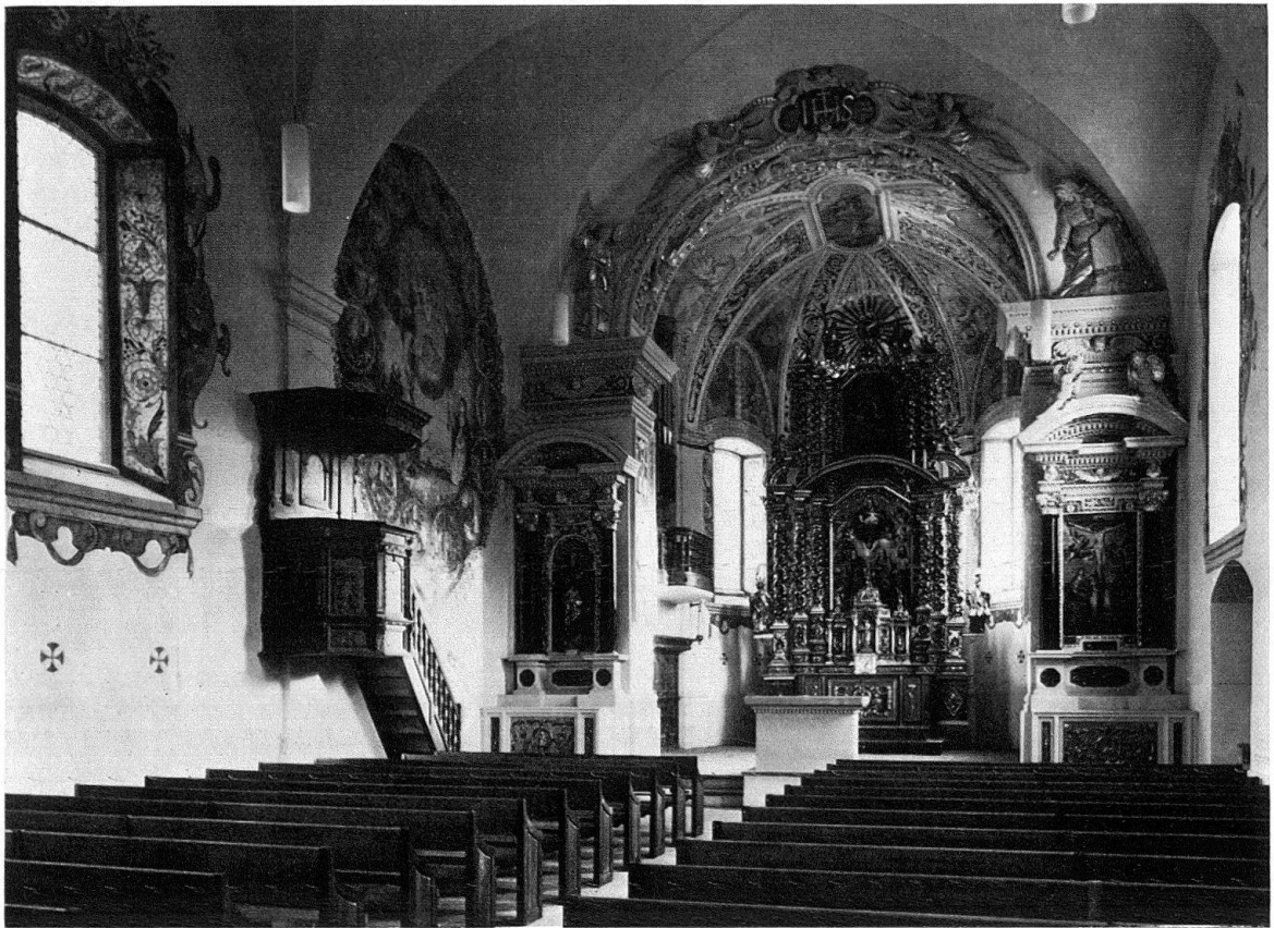
Lumbrein. Pfarrkirche St. Martin. Innenansicht gegen Chor

gens. In den Gewölbekappen konzertieren die Solisten eines himmlischen Orchesters, und in den Schildwänden thronen Kirchenlehrer und Evangelisten.