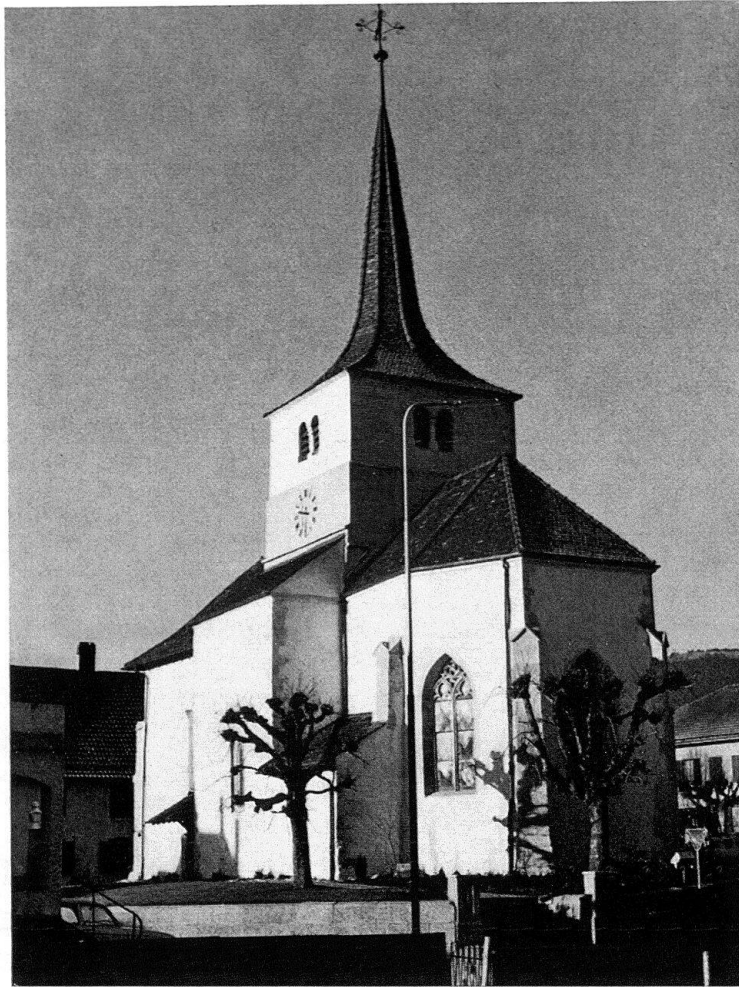
L'église de Fontaines, vue du sud-est

depuis l'automne 1969, le plus ancien quartier industriel de Neuchâtel est à nouveau dominé, de manière rendue visible à tous, par l'aîné des sanctuaires de la ville.