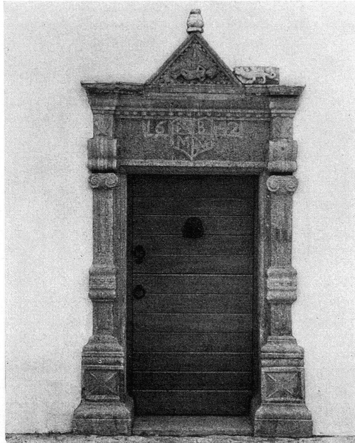
Porte aux Bourquins de Bise (La Côte-aux-Fées)

Volets repeints, chaînages d'angle, cordons d'étage, encadrements et frontons des fenêtres se détachant sur un crépi clair ont rendu à l'édifice son air pimpant; l'enlèvement d'un toit de tôle inutile sur la porte de la tourelle d'escalier a dégagé la date de construction: 1588. A l'intersection de deux routes fréquentées, la maison bâtie pour le maire Abraham Cunier – jadis accolée à des moulins – donne mieux que jamais le ton à tout le voisinage.