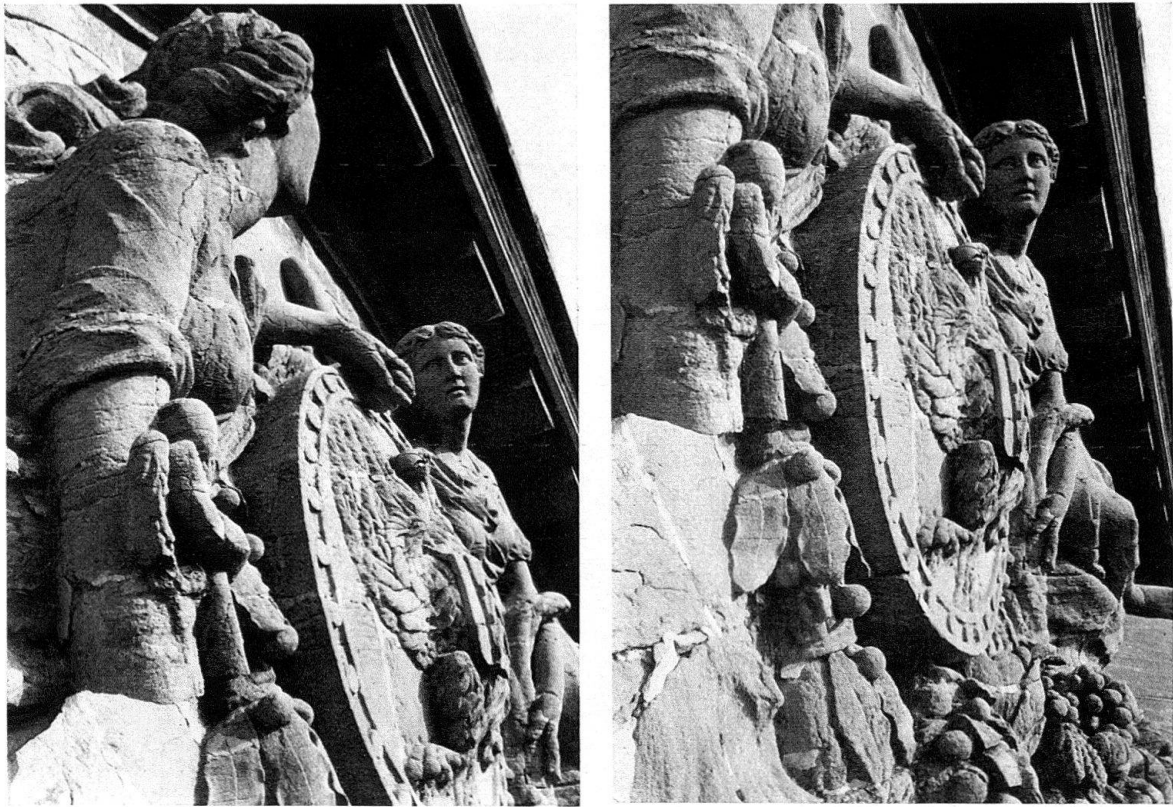
L'hôtel de ville de Neuchâtel. Détails du fronton ouest, avant la restauration