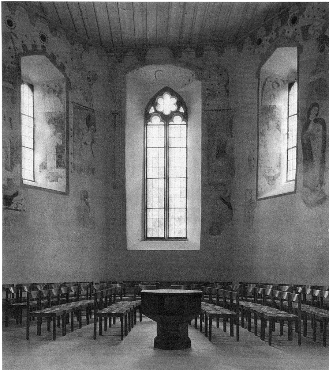
Gelterkinden, Reformierte Kirche. Blick in den Chor mit den neu entdeckten und restaurierten spätgotischen Wandmalereien

Schrägbalkenkreuz, sowie Jakobus der Jüngere mit einer Keule. Auf der linken Seite: Paulus mit Schwert und Buch, Jakobus der Ältere mit Pilgertasche und -stab, Simon mit dem Stabkreuz anstelle der sonst üblichen Säge, und Mattäus mit dem Beil. Die beiden Buchstaben P im Schriftband auf der nördlichen Chorbogenmauer weisen auf den verschwundenen Philippus hin. Der Erhaltungszustand dieser Figuren ist unterschiedlich. Ausdrucksvolle Züge prägen das Gesicht des Apostels Simon. Jenes des Jakobus des Älteren hingegen übernimmt einen Gesichtstypus, der auch bei den Engeln erscheint. Die Gewandstrukturen sind oft nicht mehr zu erkennen, zeigen sich aber dort, wo sie noch lesbar sind, durch reiche Faltenwürfe aus. Die Gestalten der Fensterleibungen besitzen dieselben Merkmale, doch sind sie und ihre Attribute teilweise noch schlechter erhalten. Rechts von