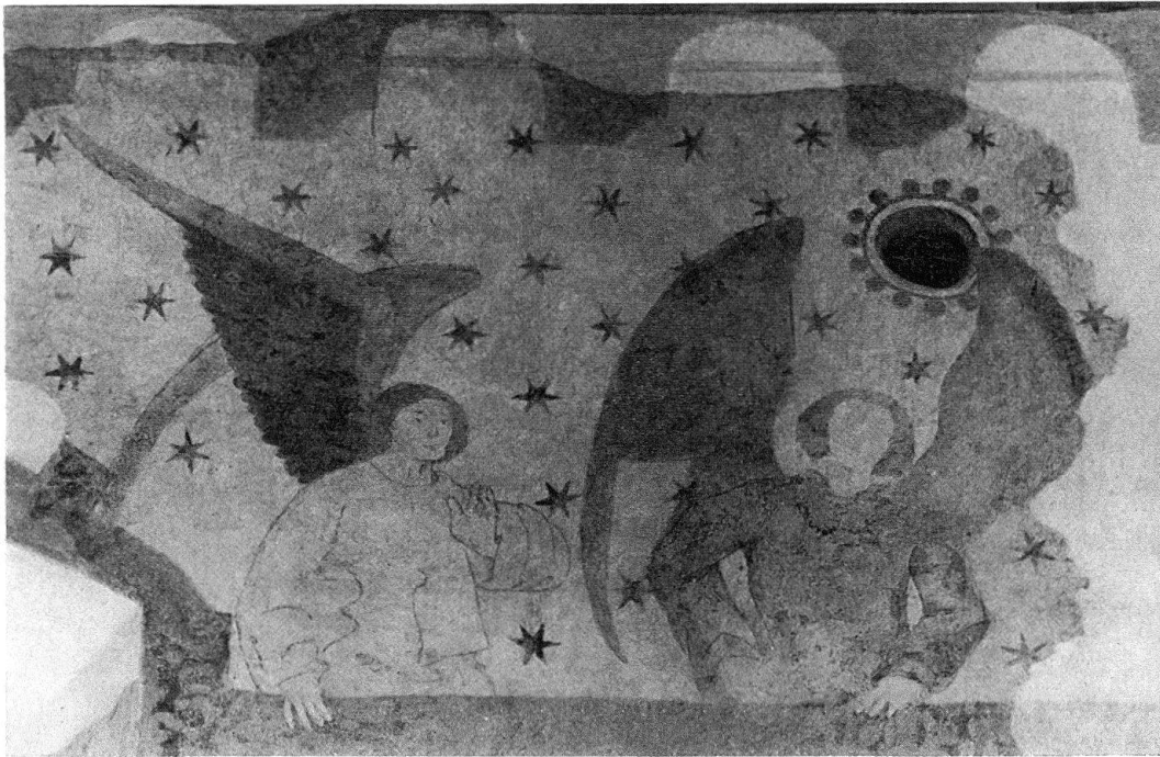
Gelterkinden, Reformierte Kirche. Detail aus den Wandmalereien im Chor: Engel unter Arkadenfries, rechts oben Schalltopf