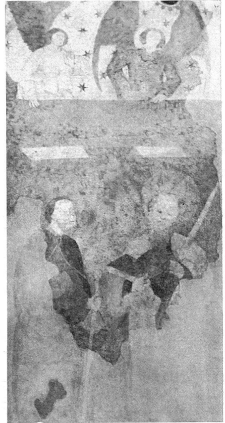
Gelterkinden, Reformierte Kirche. Details der Wandmalereien im Chor: Engel und Heilige (links), Jakobus d. Ae. und Paulus (rechts)

Johannes dem Täufer steht in der Leibung die heilige Margaretha, erkennbar am Drachen zu ihren Füßen. Links von Maria glaubt man eine Figur mit einem Kirchenmodell in der Hand zu sehen, wahrscheinlich Kaiser Heinrich, dessen Namen auch eine Kaplanei der Kirche im 15. Jh. trug. Links davon im gleichen Fenster eine Figur mit einem Hund zu Füßen, vermutlich der heilige Wendelin.