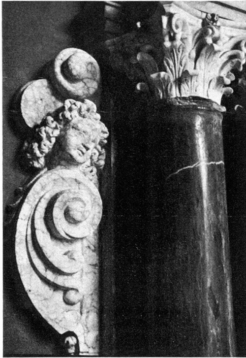
Abb. 2. Schinznach. Detail des Obergeschosses des Grabmals Johann Ludwig von Erlach aus dem braunstreifigen Alabaster wie bei Abb. 4