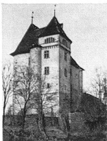
Château et temple Valangin