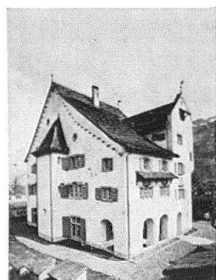
Schloß A Pro Seedorf