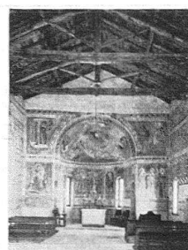
Chiesa Rossa Castel San Pietro