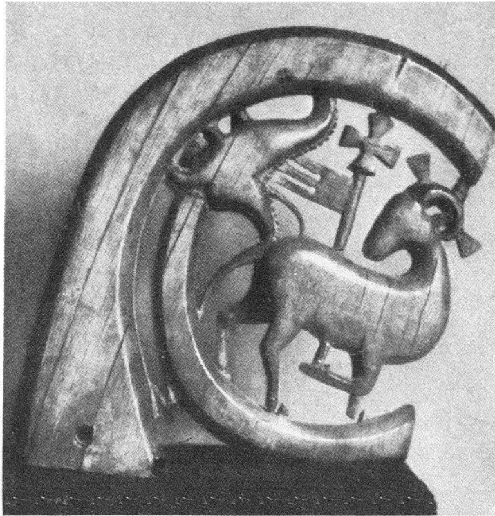
Abb. 5. Elfenbeinkrümme. Anfang 13. Jh. Paris, Louvre

fürsten Petrus und Paulus, die heiligen Johannes der Täufer, Johannes Evangelist, Antonius den Einsiedler und Maria Magdalena. Ihre Formsprache wie auch die der Schaftzwingen ist spätgotisch und vermutlich gleichzeitig wie die Elfenbeinfassung. Der Knauf könnte allenfalls nach D. F. Rittmeyer, etwas später sein. Er ist oben und unten mit sechs gebuckelten Kelch- oder Blütenblättchen geschmückt, die ein eingeritztes Maßwerk aufweisen, ähnlich der Gravur. Kein Goldschmiedezeichen verhilft zur näheren Bestimmung.