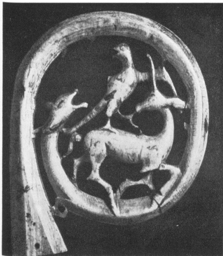
Abb. 2 Sogenannter Uttostab. Pastorale mit Elfenbeinkrümme, vergoldeter Bronzefassung, Knauf aus Bergkristall und Stab aus Eichenholz. Kurz nach 1200. Metten (Bayern), Abtei. (Aufnahme nach Pantheon, op. cit. S. 269)