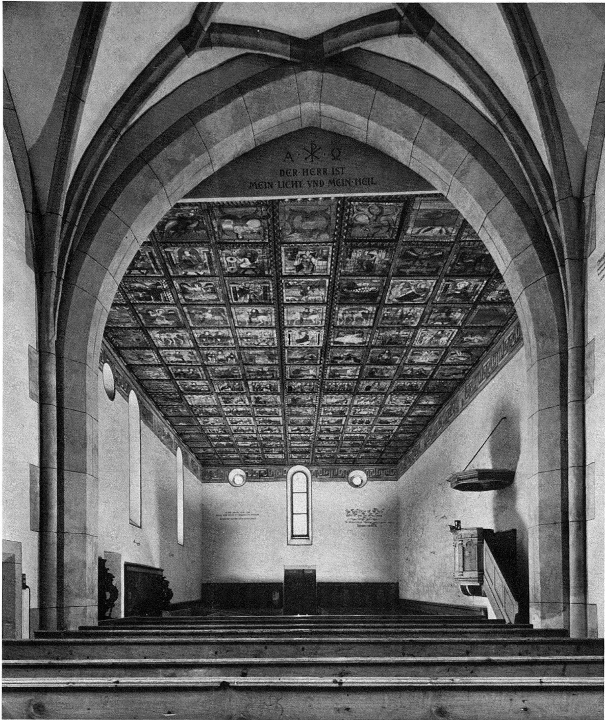
Abb. 2. Zillis, St. Martin. Inneres gegen Westen