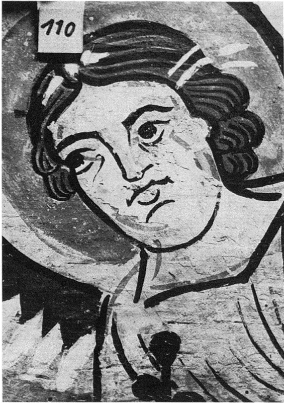
Abb. 5. Zillis, St. Martin. Kopf des Engels aus der Szene mit der Heilung am See Bethesda. Unter der Malschicht erscheint die Vorzeichnung