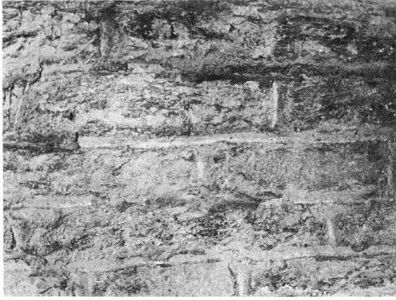
Abb. 3. Zillis, St. Martin. Nordwand, Mauerfugung mit Kellenstrich und weissen Pinselzügen nach der Freilegung