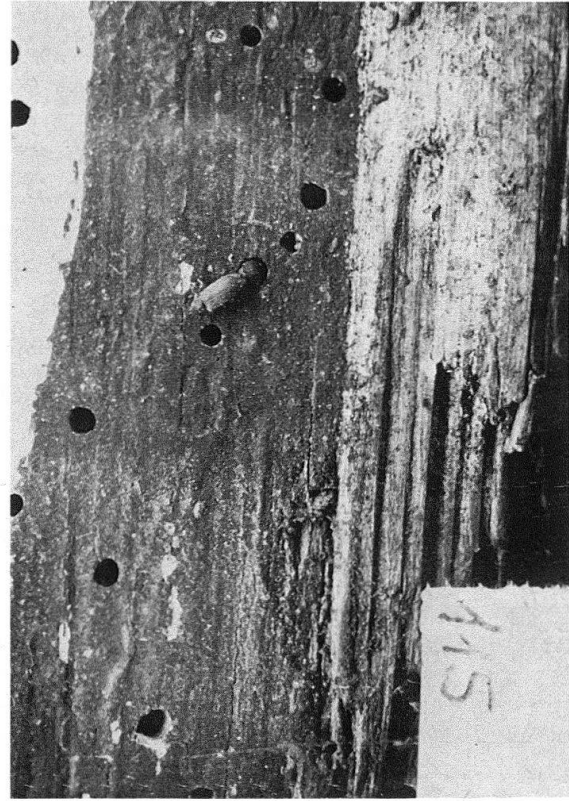
Abb. 6. Zillis, St. Martin. Holztafel mit Anobienbefall

kannte Anordnung nur in eindeutigen Fällen verändert werden sollte. Auf die geplanten Eingriffe einzugehen, erübrigt sich hier, weil das starre rechtwinklige System der Träger von 1938–1940 – das bereits der damalige Restaurator Henri Boissonnas als nicht dem Original entsprechend bedauerte – bei der Verschiedenheit der Tafelgrößen derartige Korrekturen mit zwei Ausnahmen verhinderte: beim Zug der drei Könige wurden die vorderen beiden Reiter vertauscht, so dass nach der allgemeinen Bildtradition nun der erste König auf den Stern deutet (Tafeln 65 und 64); die Tafeln des Abendmahles wurden so angeordnet, dass die Bewegung der drei Jünger zum Hauptbild mit Christus, Judas und Johannes hinführt (Tafeln 137 und 136).