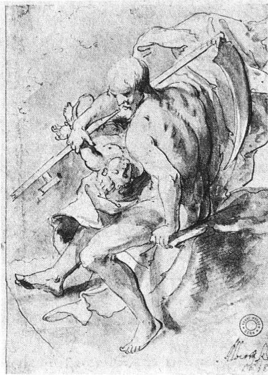
Abb. 5. Albrecht Kauw, Chronos, 1638, Feder in Schwarz, Sepia laviert über Bleistift, 19,9 × 13,7 cm. Berner Kunstmuseum

Obwohl der Spiegel auch bei Honthorst im Vanitaskontext vorkommt 35 , scheint uns auch hier die direkte Inspiration für Kauw bei diesem Bildthema eher in Frankreich zu liegen. Eine Generation vor Kauw spielt Jacques Linard in vielen seiner Stilleben mit dem Spiegel. Durch die Spiegelung zeigen sich die Stillebenobjekte von mehreren Seiten 36 . Sicherlich, es sind keine Vanitasstilleben, aber es sind immerhin Gegenstände, die sich spiegeln, keine Menschen, die sich den Spiegel vorhalten. Georges de la Tour (1593–1652) wendet bereits, wie wir gesehen haben, den Spiegel bei der Magdalendarstellung mit deutlicher Vanitasbedeutung an. Maria Magdalena spiegelt sich nicht selbst, wie man erwarten würde, sondern es spiegelt sich der Totenkopf in ihrem Schoß. Wir wiesen schon auf ein Bild aus dem Umkreis von La Tour hin, bei dem auch durch die Darstellung der Tulpen eine gewisse Verwandtschaft mit dem Vanitasbild von Kauw besteht (Abb. 4). Hier ist die Übereinstimmung fast noch augenfälliger: In dem etwas schräg gestellten Spiegel am linken Bildrand spiegelt sich der Totenkopf. Bei Kauw spiegelt sich ein anderes eindeutiges Zeichen der menschlichen Vergänglichkeit: die Kerze.