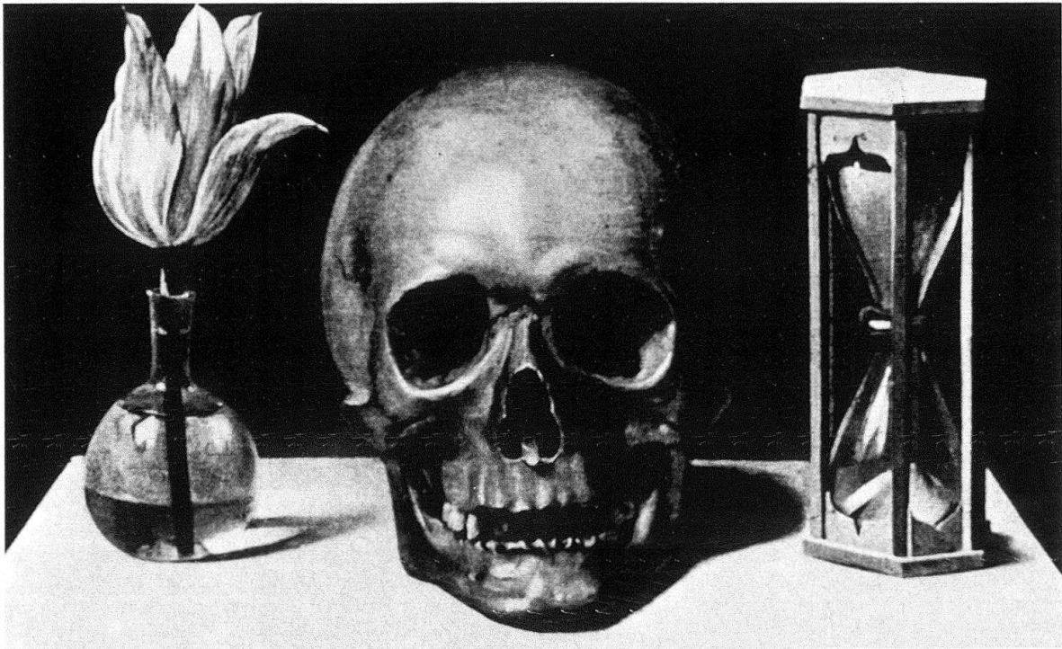
Abb. 3. Umkreis des Philippe de Champaigne, Vanitasdarstellung, Öl auf Holz, 28,5 × 37,5 cm. Le Mans, Musée des Beaux-Arts

frühen Stilleben Kauws einen Hinweis auf seine künstlerische Herkunft suchen, die ja völlig im dunkeln liegt. Das Bild weist am ehesten auf Frankreich hin. Nicht unbegreiflich, da ja Strassburg, wo Kauw bis 1640 lebte, obwohl zu Deutschland gehörig, künstlerisch ebenso sehr auf Frankreich als auf Deutschland ausgerichtet war 16 . In einem Kupferstich von Nicolas de Platte-Montagne nach Philippe de Champaigne (Abb. 2) und in einem Bild, das man Champaignes Umkreis zuschreibt (Le Mans, Musée des Beaux-Arts) (Abb. 3), beide undatiert, sieht man die Austauschbarkeit der Symbole Rose und Tulpe. Die Komposition ist beide Male sehr einfach: zentral ein Totenkopf, links davon eine Blume (eine knospende, blühende und welkende Rose bzw. eine Tulpe), rechts davon eine Uhr (Taschenuhr bzw. Sanduhr). Ein anderes, ebenfalls undatiertes Bild, das man dem Umkreis von Georges de la Tour zuschreiben muss (Paris, Louvre), zeigt in einem Vanitasstilleben, durch Bücher etwas verstellt, ein Gefäß mit mehreren Tulpen (Abb. 4). Wir werden auf dieses Bild bei dem Spiegelmotiv zurückkommen.