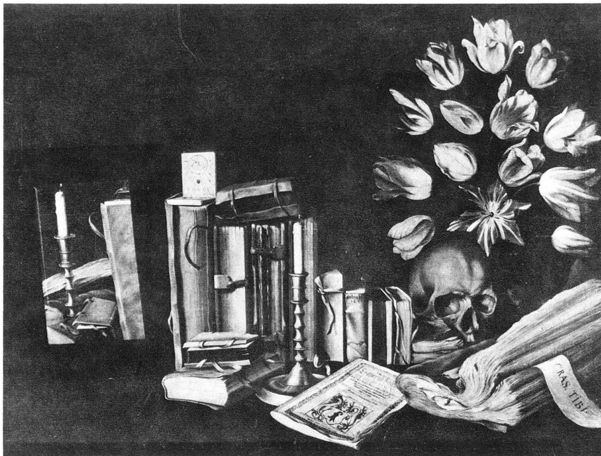
Abb. 1. Albrecht Kauw, Vanitasstilleben, 1649, Öl auf Leinwand, 81 × 106 cm. Standort unbekannt

sen. Zwar sind sie in einem Fayencekrug im Hintergrund plaziert, aber der Strauss wirkt sowohl durch seine Farbigkeit als auch durch seine Höhe als Blickfang; er ist derjenige Gegenstand im Bild, an dem das Auge zuerst haften bleibt. Die einzelnen Tulpenblüten des Strausses sind schematisch angeordnet; sie stehen betont nebeneinander und überdecken sich nicht. Hier kündigt sich bereits ein Kompositionsprinzip an, das Kauw in seinen späteren Vorratskammerbildern beibehalten wird: das streng dekorative Nebeneinander der Bildgegenstände, innerhalb dieser Komposition aber eine naturalistische Darstellung der gewählten Pflanzen, Früchte und Tiere 5 .