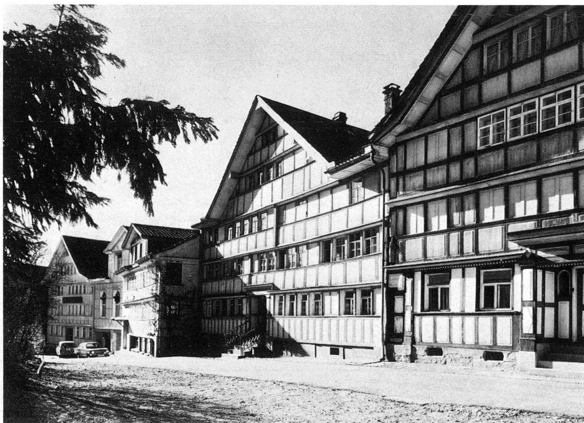
Abb. 1. Schwellbrunn, Dorfpartie nordöstlich der Kirche