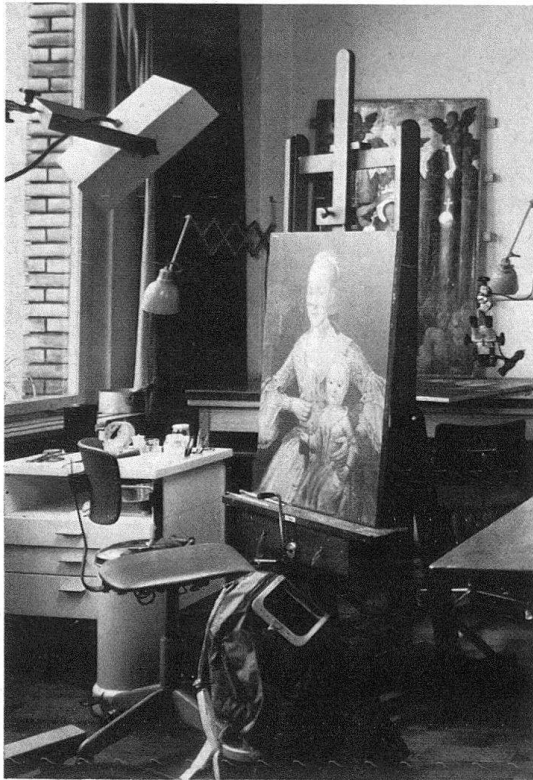
Abb. 2. Atelier für Gemälderestaurierung