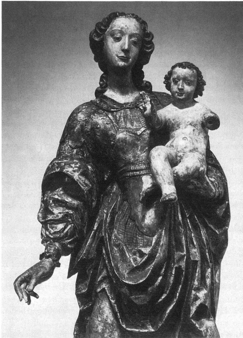
Abb. 1. Schweiz. Landesmuseum. Madonna mit Kind, um 1640 Joh. F. Reyff (etwa 1618–1673) zugeschrieben. Lindenholz, Höhe 160 cm. LM 29358

lende Arbeit zu bewältigen, wobei die reine Administration auf das kaum erträgliche Minimum beschränkt ist.