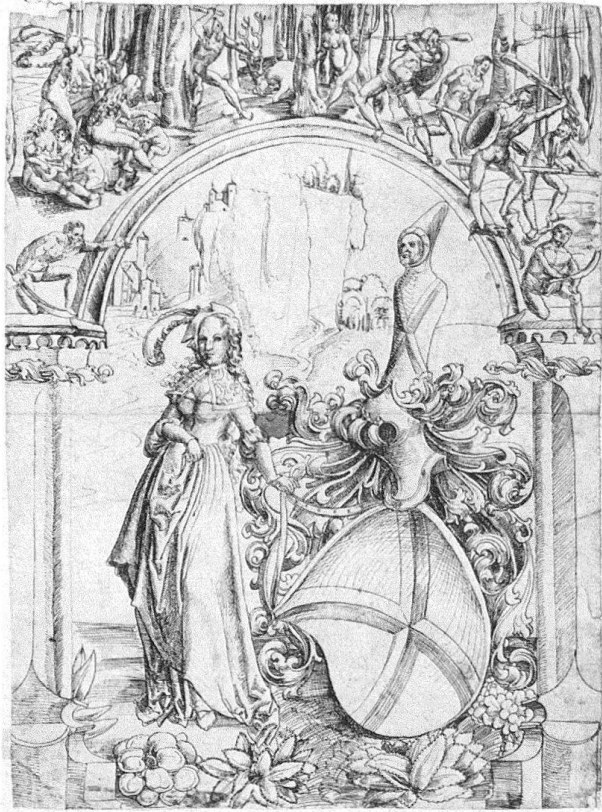
Abb. 1. Niklaus Manuel Deutsch zugeschr. ...

immer ein Zentrum und haben nicht von ungefähr bis zu den Künstlern unserer Tage weitergewirkt.