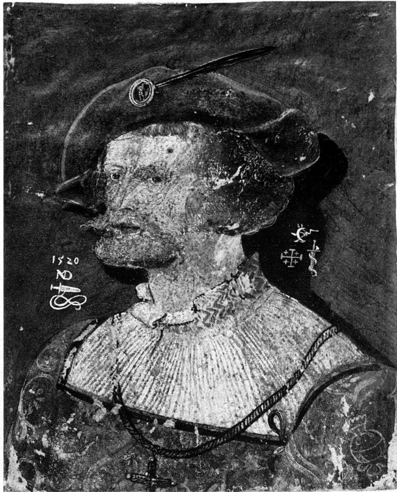
Abb. 2. Niklaus Manuel: Bildnis eines Ritters, 1520. Pergament (Bern, Kunst- museum)

Ritters aus: sehr klein und kreisrund gefasst, zugleich der Befestigung der Feder dienend, zeigt es einen Akt, der sich auf Schild und Stange stützt. Die Farbe dieses Barettzeichens ist blaugrau, die Figur hell aufgesetzt. Dieses Motiv war sowohl in Italien als auch – von dort übernommen – nördlich der Alpen geläufig. Die Figur findet sich – in erstaunlicher Übereinstimmung mit der unsern – auf einer Schaumünze des Ercole I d’Este von 1472 als Herkules neben den nach ihm benannten Säulen stehend 7 oder auch als weiblicher Akt in einem Wandmedaillon hinter der «Verkündigung Mariae» im «Breviarium Arosiense», das 1512 in Basel erschien (Abb. 4). Manuel selbst hat in seinem «Schreibbüchlein» in ornamentalem Zusammenhang ähnliche Figuren festgehalten. Wo auch immer eine solche Figur erscheint, erweckt sie die Assoziation an das klassische Bildungsgut der Antike und der italienischen Renaissance. Ob es sich um Herkules, Mars, Neptun oder Pallas Athene handelt, kann, wie auf unserem Barettzeichen, sehr oft nicht ausgemacht werden. Aber unser Ritter, der sonst so ganz und gar unitalienisch dargestellt ist, erhält auf diese Weise ein Attribut klassischer Kultur. – Um den Hals liegt eine goldene Kette mit Kreuz.