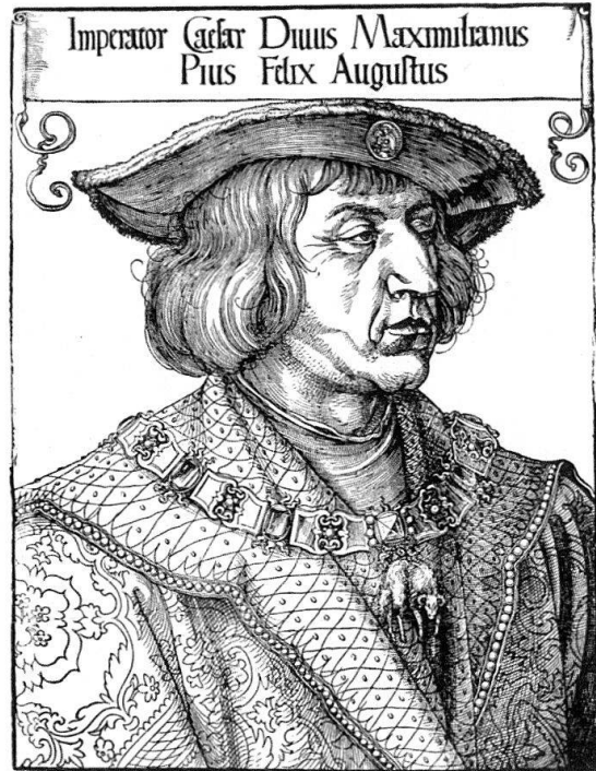
Abb.9. Albrecht Dürer: Kaiser Maximilian I. 1519. Holzschnitt