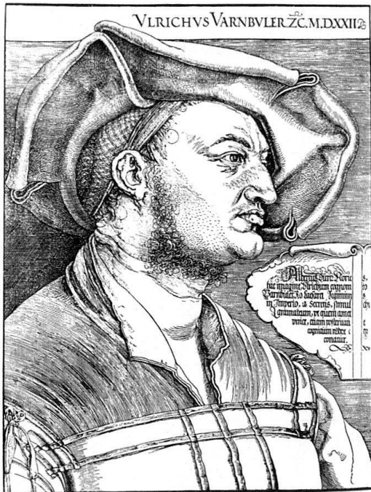
Abb. 10. Albrecht Dürer: Bildnis des Ulrich Varnbüler. 1522. Holzschnitt