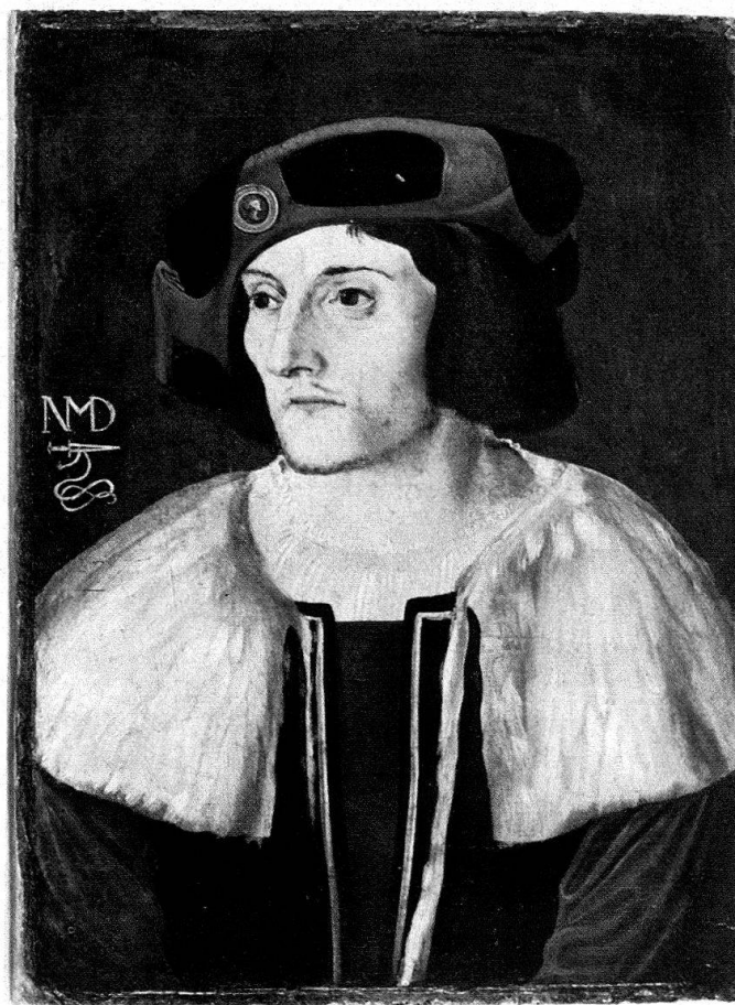
Abb. 7. Niklaus Manuel: Sogenanntes «Selbstbildnis». Holz (Bern, Kunstmuseum)

Manuels «Bildnis eines Ritters» ist durch die Haartracht, die Stellung und Form des Baretts mit seiner Medaille und die zeichnerische Behandlung des Stoffmusters mit der Zeichnung und dem Holzschnitt Dürers verwandt. Zu den gemalten Bildnissen ist die Beziehung weniger eng, da Dürer Hände, Wappen und Inschriften hinzufügt. Doch trägt der grüne Hintergrund mit den gelben Aufschriften der Wiener Fassung ein weiteres verwandtes Element bei. Die Verwendung von Gold in den Kragen und in der Kette bei Manuel weckt die Vermutung, er habe eine mit Gold unterlegte Fassung des Maximilian-Holzschnittes gekannt.