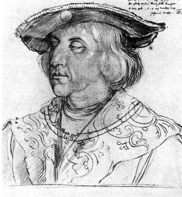
Abb.8. Albrecht Dürer: Kaiser Maximilian I. 1518. Kohle und farbige Kreide; Beschriftung Feder (Wien, Graph. Sammlung Albertina)