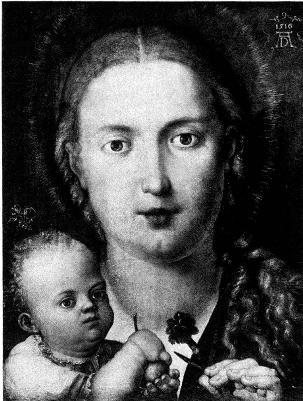
Abb. 12. Albrecht Dürer: Maria mit d. Nelke. 1516. Pergament (München, Alte Pinakothek)