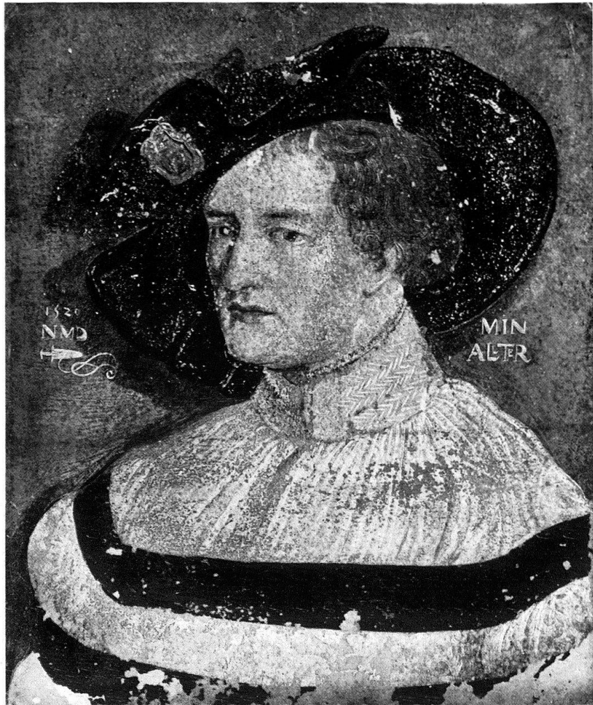
Abb. 1. Niklaus Manuel: Bildnis eines jüngeren Mannes, 1520. Pergament (Bern, Kunstmuseum)

bis und mit dem Buch von MANDACHS behauptete, unser Ritter sei wegen seiner Ähnlichkeit mit dem «Herzog» mit Caspar von Mülinen zu identifizieren. Dies trifft wohl für das Bildnis in Privatbesitz zu, keineswegs jedoch für unser Bildnis, das mit dem «Herzog» im Totentanz keine Ähnlichkeit aufweist. So müssen wir uns damit abfinden, dass die Identität der beiden Dargestellten bis zu einer glücklichen Entdeckung verschwiegen bleibt.