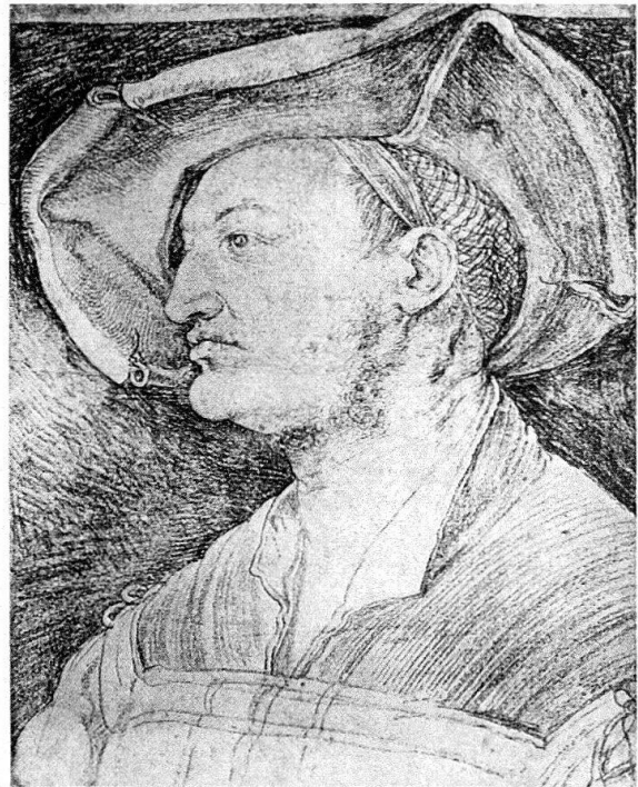
Abb. 11. Albrecht Dürer: Bildnis des Ulrich Varnbüler. Kohle (Wien, Graph. Sammlung Albertina)

gament gemalt sind, «Madonna mit der Nelke» in München (Abb. 12) und «Bildnis eines Geistlichen» in Washington (Abb. 13). Während frühere Werke Dürers auf Pergament zuweilen an der Grenze zwischen Malerei und Zeichnung standen, haben diese zwei Bilder eindeutig den Charakter vollendeter Gemälde. Wir treffen in diesen Gemälden grünen Hintergrund, «frei schwebende» Signaturen, bei der Madonna und – etwas weniger ausgeprägt – beim «Bildnis eines Geistlichen» auch den Schlagschatten. Zusammen mit dem auf Holz gemalten Bildnis Wolgemuts im Germanischen Nationalmuseum und dem nicht vor 1518 auf Leinwand gemalten «Bildnis Jakob Fuggers in der Pelzschabe» in Augsburg sind die Bilder von 1516 die letzten vor den Maximilian-Bildnissen entstandenen und erhaltenen Bilder Dürers. Ob auf Pergament gemalte weitere Bildnisse Dürers in die Zwischenzeit fallen, bleibt ungewiss. Tatsache ist, dass unsere beiden Bildnisse von Manuel als Pergamentmalereien ihre Vorläufer in Werken wie den zwei erwähnten Dürers von 1516 besitzen.