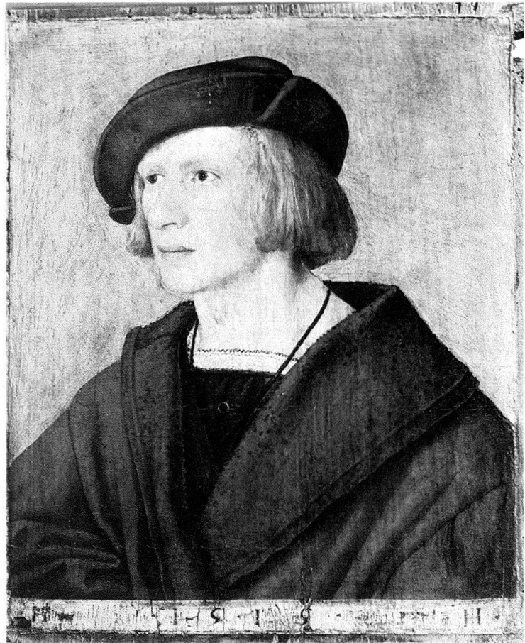
Abb.6. Ambrosius Holbein oder Hans Holbein d.J.: Bildnis eines jungen Mannes, 1515. Holz (Darmstadt, Hessisches Landesmuseum)

Gleichgewicht und dem «leeren» Hintergrund, wie auch dem wesentlich weniger frei als in den späteren Bildnissen hineinkomponierten Monogramm dem Darmstädter Bild näher.