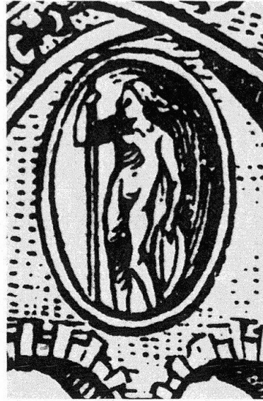
Abb. 3. Urs Graf: Medaillon mit hl. Georg aus einer Zeichnung mit zwölf Medaillons. Feder (Basel, Kupferstichkabinett)