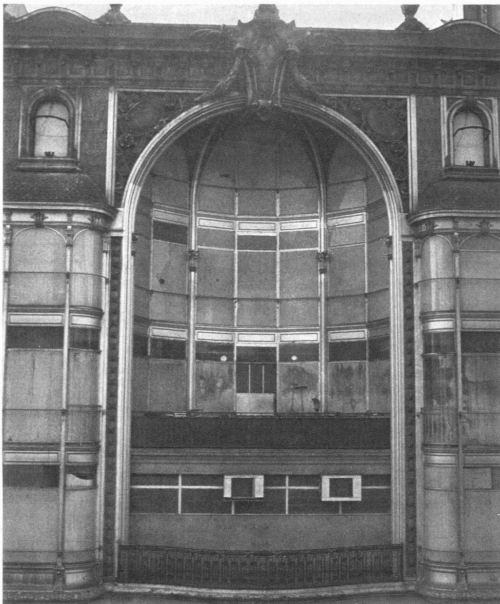
Rue de la Croix-d'Or, n° 4. La façade dans son état actuel. Mars 1976

la zone inférieure. La composition de la façade est encore scandée par le rythme d'une frise verticale qui suit, de part et d'autre, l'envolée des bow-windows.