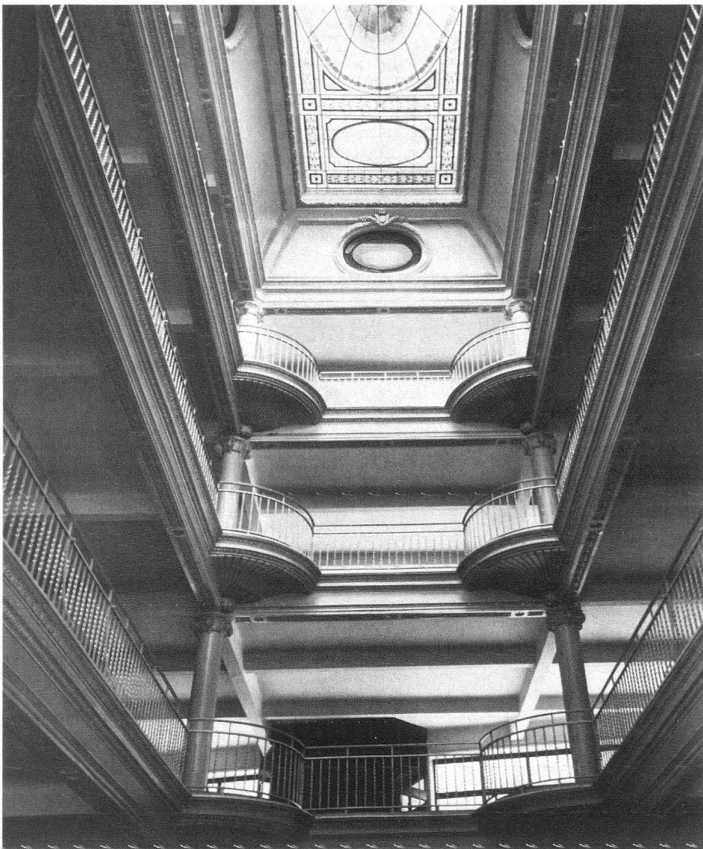
Intérieur de «Old England». Les galeries au pourtour rectangulaire sont supportées par des colonnes placées aux angles. Aux environs de 1912

La façade actuelle, quelque peu modifiée par l'adjonction d'un deuxième balcon, aussi inélégant qu'inutile, et par un placage de marbre au rez-de-chaussée, se lit dans son état originel. La surface vitrée est malheureusement aujourd'hui dépolie et la partie antérieure de l'édifice ne laisse plus transparaître la lumière. Une paroi métallique grise d'un triste effet a remplacé les fenêtres du premier étage. Cette métamorphose est due au changement de la distribution interne des locaux : pour gagner de la place, on a substitué des sols au vide central. L'organisation extérieure s'est pratiquement maintenue : deux bow-windows s'élèvent du premier étage, encadrant la concavité du corps médian. De fines armatures nervurées (maintenant grises) convergent vers le sommet de cette demi-voûte, couvert d'une mosaïque multicolore au masque grimaçant. Un cartouche de couronnement surmonte le tout, répondant à l'avancée sinueuse du balcon de