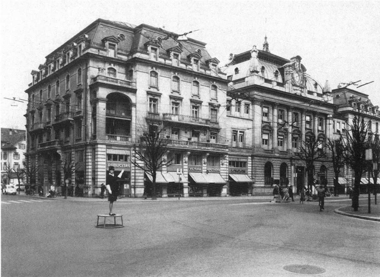
2. 1905 wird der ganze Komplex abgebrochen, zusammen mit vier Wohngebäuden an der dahinterliegenden Buobenmattstrasse. Auf dem Areal errichtet die Kantonalbank 1906–1909 ein Verwaltungsgebäude nach Plänen von Architekt Hans Müller.

erscheinen. Es ist nicht nur die Patina ehrwürdiger Vergilbtheit, welche das Vertraute so verfremdet; die dargestellte, urbane Lebensform selbst ist für den heutigen Städter unwirklich, fast unvorstellbar geworden: gemächliche Fuhrwerke belebten Strassen und Plätze, die wir nur mehr als unwirtliche Verkehrskloaken kennen, und wo sich heute gläserne Bürogebäude auftürmen, zeigt die Photo kleine, verschachtelte Häuserzeilen mit Krautgärtchen vor den Türen.