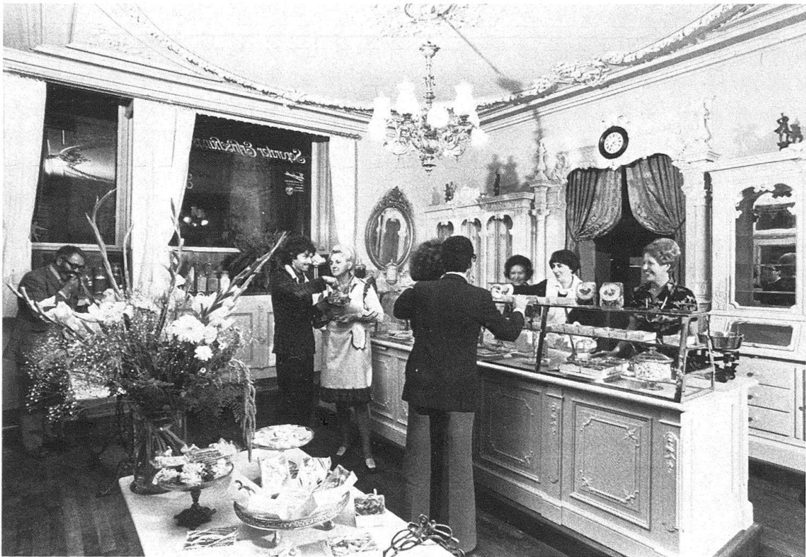
Zürich, Conditorei Schober, Napfgasse 4. Das erfreulichste Resultat der Restaurierungen der Stadtzürcher Denkmalpflege im Jahre 1976

Der Ankauf des Werkhofes an der Glärnischstrasse 40 zur Erhaltung eines Beispiels anonymer Architektur aus dem Jahre 1839 und eines wichtigen Grünbereiches am