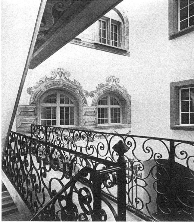
Zürich, «Unteres Rech», Neumarkt 4. Restaurierte Fassadenmalerei in Grisaille- Technik, 16. Jh.