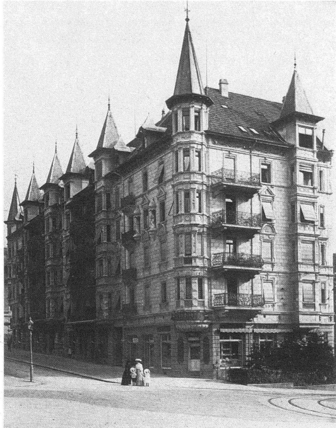
Zürich. Links: Haus «Falkenstein», Schanzengasse 20/22, erbaut 1866 von Architekt Theodor Geiger. – Rechts: Häuserblock Asylstrasse 64, erbaut 1895/1897 von Architekt J. Scheck.

kerung als wichtige Zeugen dörflicher Vergangenheit als Ortsmuseen und Wohnungen übergeben werden.