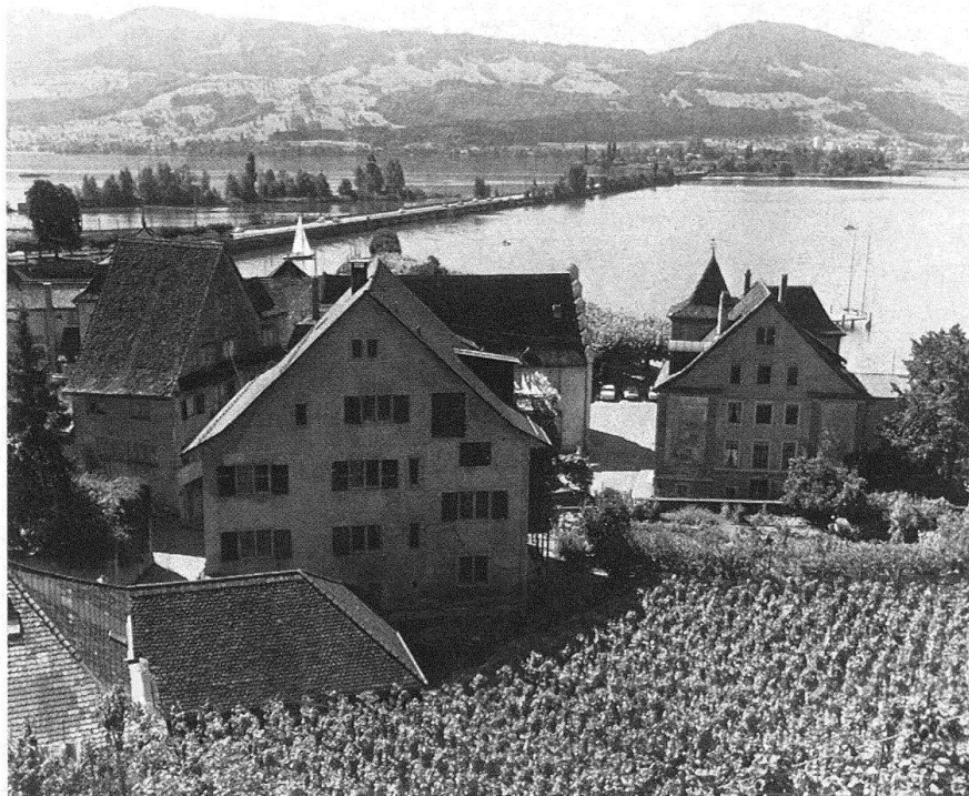
Rapperswil. Blick vom Lindenhof auf den Stadtteil Endingen mit dem «alten Schwanen», «Schlossberg» und Curti-Haus (rechts), vor der Restaurierung 1976

Saaltrakt zum Hotel Schwanen kam. Als im spätern 19. Jahrhundert die Quaianlage aufgeschüttet wurde, trat das Curti-Haus stark ins Blickfeld der Spaziergänger.