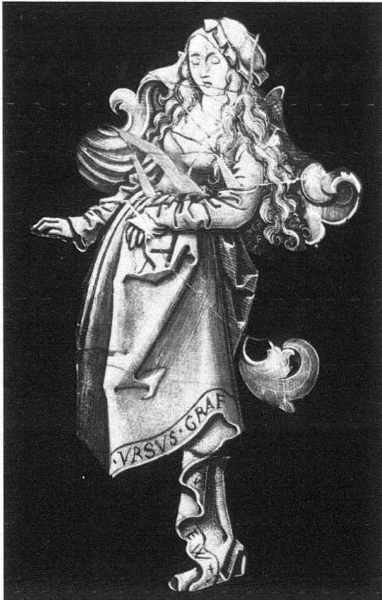
Fragment einer Wappenscheibe von Urs Graf. Um 1508. Schweizerisches Landesmuseum Zürich