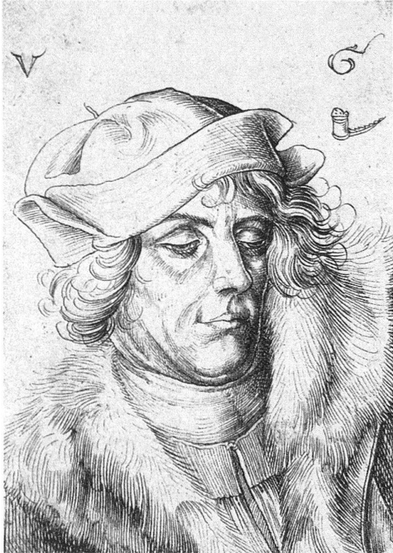
Bildnis eines jungen Mannes, Federzeichnung von Urs Graf. Um 1507. Kupferstichkabinett des Kunstmuseums Basel