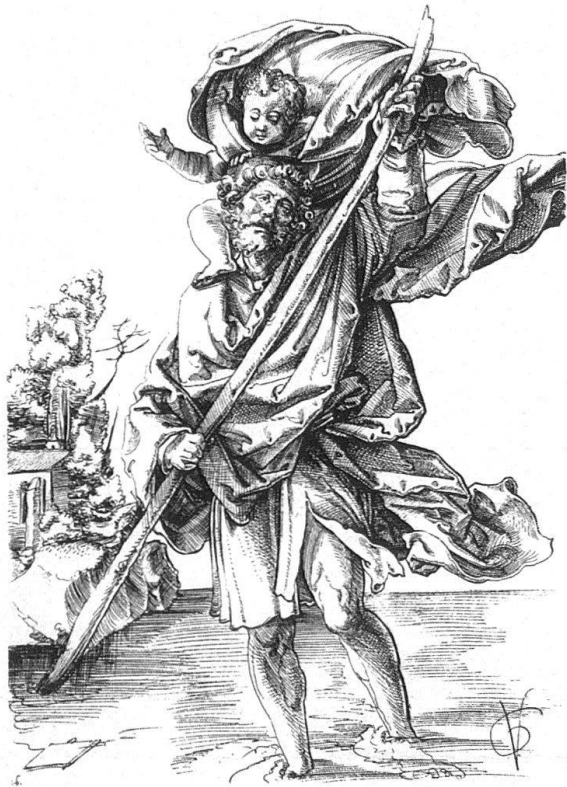
Heiliger Christophorus, Federzeichnung von Urs Graf. Datiert 1513