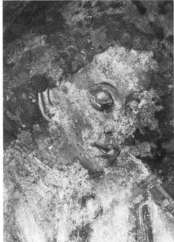
Kopf eines auferstehenden Jünglings, Freilegungsprobe vom Jüngsten Gericht an der Westwand der Kirche von MuttENZ. 1507