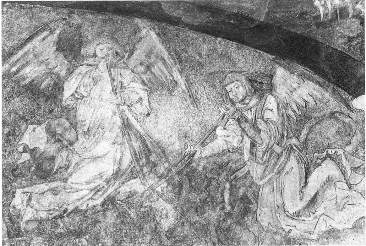
Engel aus dem Jüngsten Gericht im Beinhaus von MuttENZ, 1513

noch auf die Entwürfe für die Glasgemälde in der Basler Kartause hingewiesen werden, welche Kogler Urs Graf zugeschrieben hat. Da diese 1507 geschaffen worden sind, sind sie ausserdem ein Beweis für die Anwesenheit Grafs in der Rheinstadt.