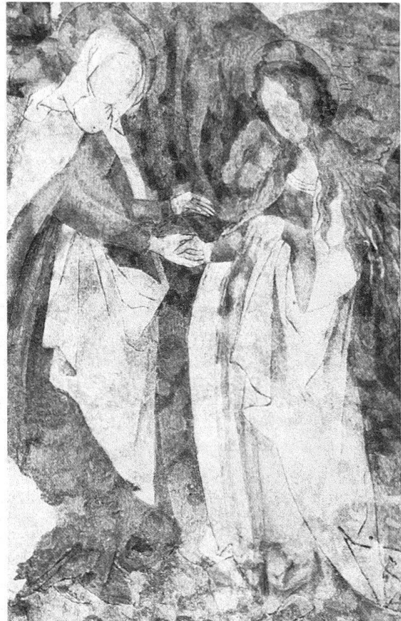
Begegnung von Maria und Elisabeth, Ausschnitt aus einem Wandbild an der Südwand der Kirche von Muttenz. 1507

geblieben. Wir stellen einander gegenüber den freigelegten Kopf eines auferstehenden Jünglings und der Federzeichnung in Tusche mit dem Antlitz eines jungen Mannes. Das kostbare Blatt aus dem Kupferstichkabinett in Basel ist gegenwärtig im Kunstmuseum Basel ausgestellt. Es trägt die Signatur Grafs VG und die für die Frühwerke typische Boraxbüchse und dürfte in der Zeit um 1507 entstanden sein. In Form und Ausdruck sind Auge und Mund bis in Einzelheiten identisch. Dem Ausschnitt aus dem Wandgemälde kommt deshalb besonderes Gewicht zu, weil der Restaurator hier bei der Freilegung bis zur authentischen Malschicht vorgedrungen ist. Übrigens erscheint das Porträt eines jungen Mannes ein zweites Mal im Werk von Urs Graf, diesmal als Halbfigur mit Taschensonnenuhr.