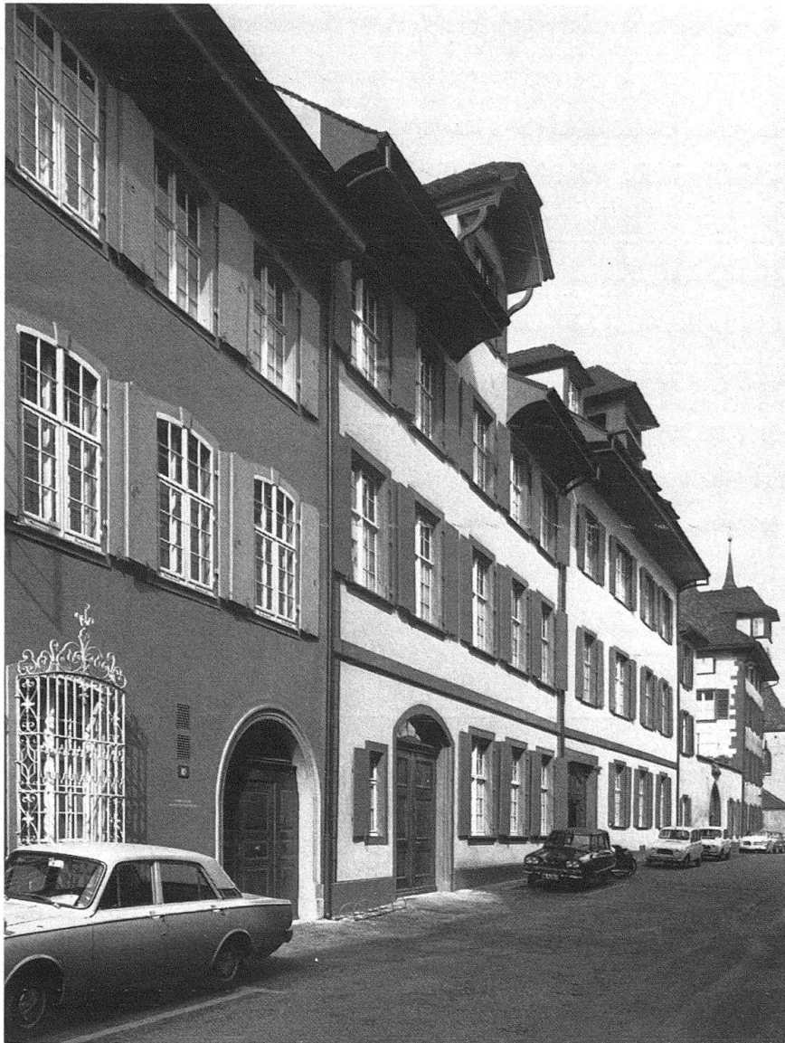
Basel. Nadelberg 10-4. Blick gegen Peterskirche mit «Schönem Haus» (Nr. 6), und «Schönem Hof» (Nr. 8); ganz links Zerkindenhof (Nr. 10). Nach der Restaurierung, Herbst 1969

12 Vgl. FRANÇOIS MAURER, Die Kunstdenkmäler des Kantons Basel-Stadt , Bd. IV, Basel 1961, Abb. 192, 209.