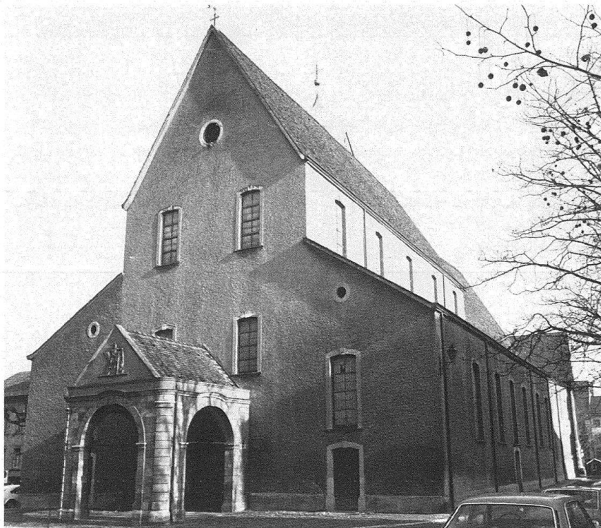
Rheinfelden. Christkath. Pfarrkirche. Der mittelalterliche Baukörper ist erhalten. Nur Vorhalle und Befensterung weisen auf die spätern Veränderungen im Innern hin

Die Verlängerung des Chors um ein Joch – zum Stift gehörten inzwischen einige Kaplaneien – gibt der Urkunde von 1336 einen konkreten Inhalt. Da man in der Regel um Ablassbriefe erst dann bettelte, wenn die anderen Geldquellen erschöpft waren, mögen 1336 die Arbeiten bereits im Gange gewesen sein. Die äussere Gestalt dieses Baus ist nicht näher bestimmbar. Gleichartig bei beiden Südfenstern sind die Masswerkspuren, die im und über dem barocken Fensterabschluss zu sehen sind. Die aus dem Falz herauslaufenden Masswerkteile im Kämpferbereich lassen in Anbetracht der Fensterbreite ein zweiteiliges Fenster als sicher erschliessen. Das Weihedatum 1352 scheint den Abschluss einer weiteren Bauphase zu markieren, die den Chor um sein drittes Joch und den Polygonschluss erweiterte. Deutlich sichtbar ist die Ansatzstelle, da die Mauer bis auf Fensterbankhöhe aus Hausteinen errichtet wurde. Von der Fensterbank treppenartig aufsteigend, bilden die Hausteine schliesslich nur noch die zum Dachgesims durchlaufende Eckquaderung. Ähnlich wie beim wenig jüngeren Chor der Leonhardskirche in Basel fehlen Strebepfeiler, was zeigt, dass eine massive Wölbung nicht vorgesehen