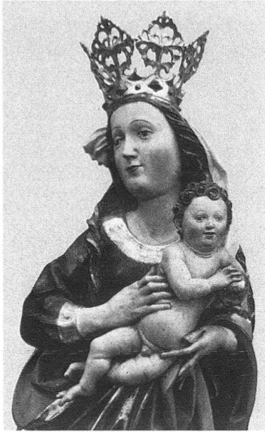
Brigels, Kapelle St. Eusebius. Madonna. Um 1486; Yvo Strigel zugeschrieben