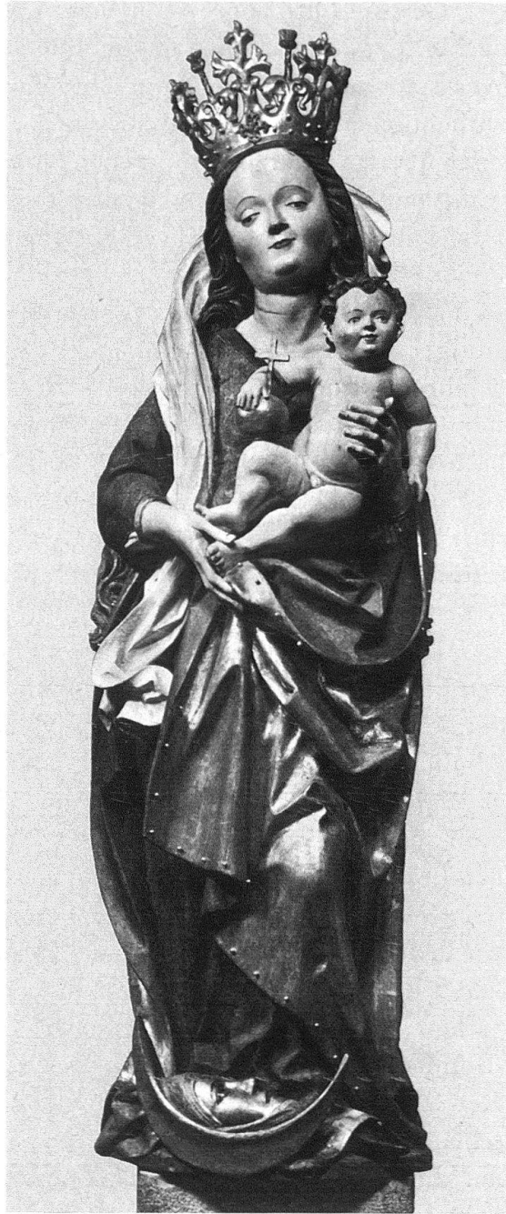
Disentis, Pfarrkirche. Madonna aus dem 1489 signierten Flügelaltar des Yvo Strigel

gen und Vergleiche gelten grundsätzlich im Verhältnis zu allen diesen Madonnen, ob- schon gewisse Abwandlungen und stufenweise Ausprägungen einzelner Motive fest- stellbar sind. Keine dieser drei Strigel zugeschriebenen Marien erweist sich in Wuchs, Haltung, Gewandung und mit dem Kind der Disentiser Maria in dem Masse ähn- lich wie die Näfelser: alle fünf Figuren gleichen sich mehr als viele leibliche Schwestern, wie Zwillingsschwestern aber erscheinen unter ihnen die Marien in Disentis und Näfels.