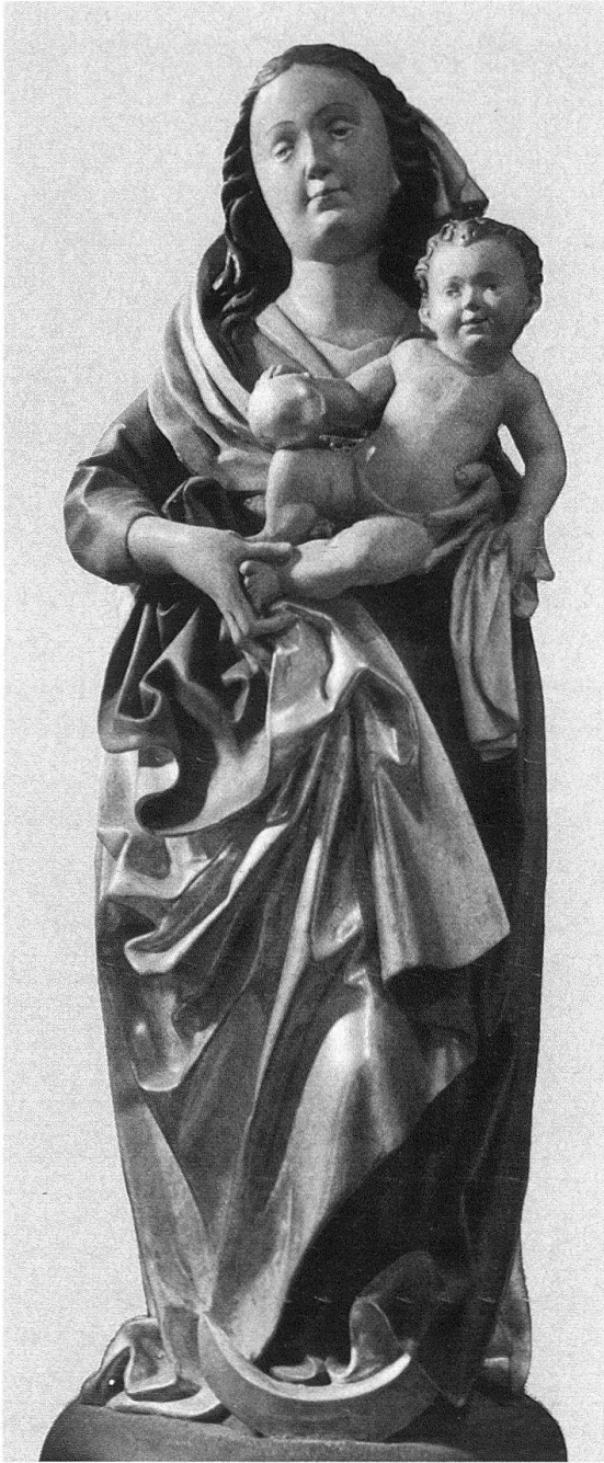
Näfels, Friedhofkapelle. Madonna. Um 1490; Yvo Strigel zugeschrieben