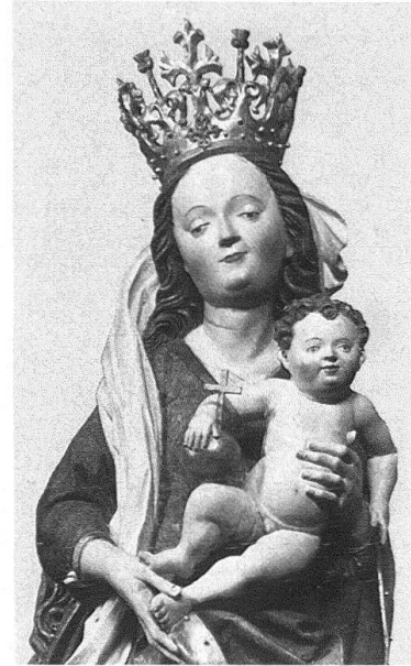
Disentis, Madonna, 1489