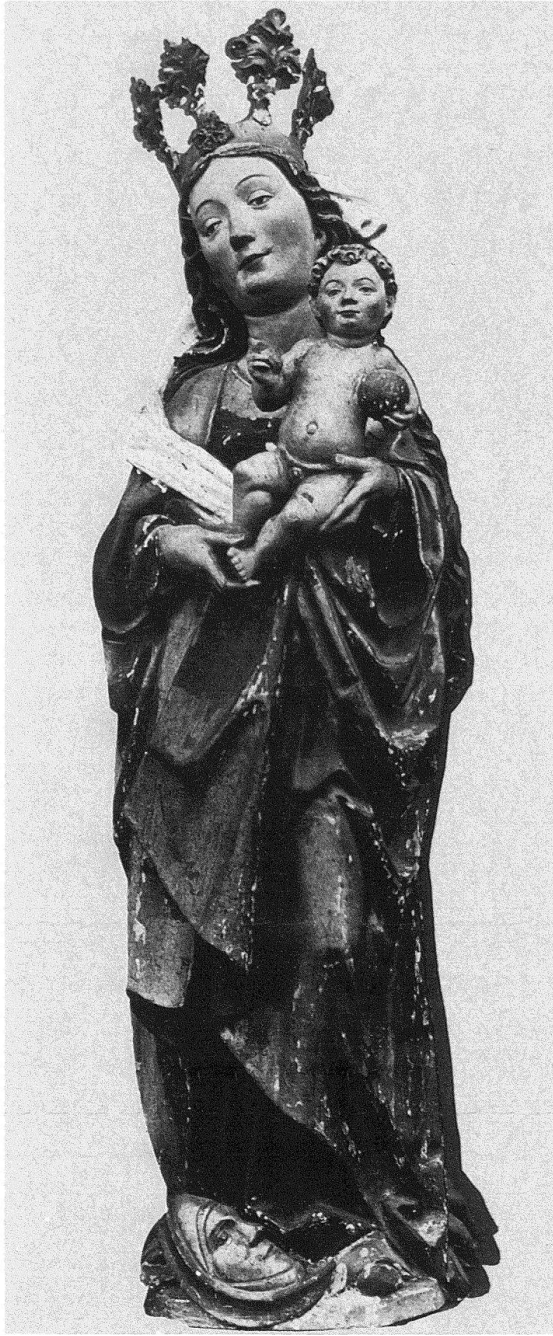
Obersachsen, Kapelle St. Georg in Meierhof. Madonna aus dem Flügelaltar. Um 1490; Yvo Strigel zugeschrieben