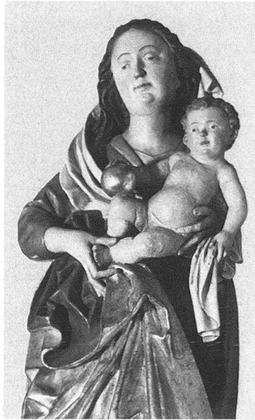
Näfels, Madonna, um 1490