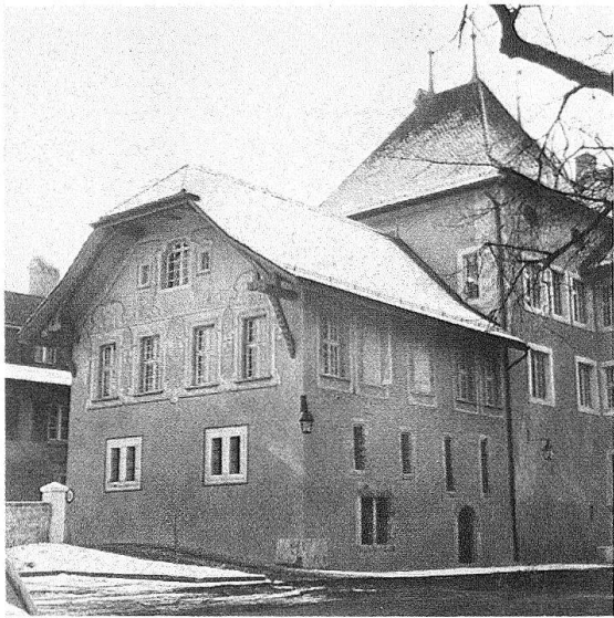
Wangen a. d. A. Amtshaus. Der Palas von Norden mit der gemalten Scheinarchitektur im Obergeschoss, 1751/52