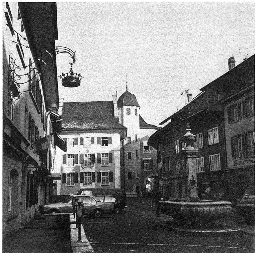
Wangen a. d. A. Das Amtshaus von der S-Seite mit der barocken Fassade von 1785 und dem Treppenturm

Die Restaurierung, die durch die Zusicherung von Subventionen der Eidgenössischen und Kantonalen Denkmalpflege gefördert wird, hat auch dadurch einen besonders erfreulichen Abschluss finden können, dass private Leihgeber sich bereit erklärt haben, die Interieurs mit passendem Mobiliar und mit Bildern auszustatten. Damit ist das Schloss Wangen in alter Schönheit wiedererstanden – und der Berichterstatter ist ein bisschen stolz darauf, dass er ein Kunstdenkmal pflegen durfte, dem schon seit jeher Mitglieder seiner Familie und direkte Vorfahren besondere Liebe haben angedeihen lassen.