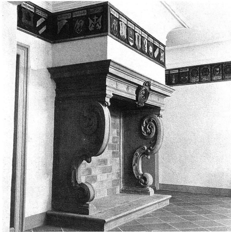
Wangen a. d. A. Bergfried des Amtshauses. Der Sandsteinkamin von 1668 und der Wappenfries der 80 Landvögte und vier Amtmänner von 1406–1831; 1664 von Albert Kauw neu gemalt und später fortgesetzt durch verschiedenste Künstler