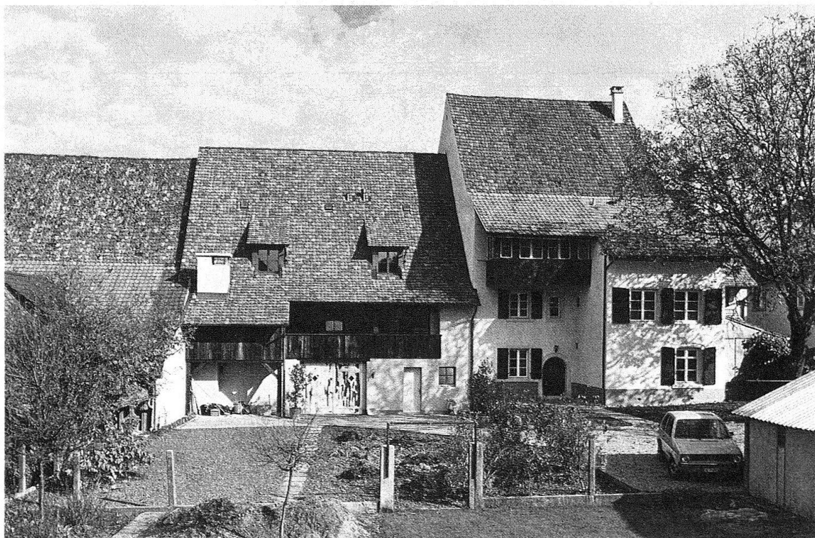
Itingen. Blick auf die noch nicht ganz vollendete Rückseite, auf der sich der Scheunenteil – mit der Laube und dem Tor als Wohnteil umgestaltet – dennoch rustikal ausnimmt. Die prekären Lichtverhältnisse verlangten den Einbau von zwei schmalen Dachaufbauten