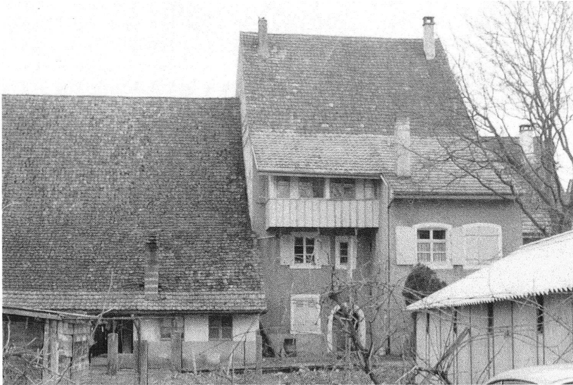
Itingen. Blick auf die sehr vernachlässigte Rückseite, auf der das Scheunendach tief heruntergezogen ist