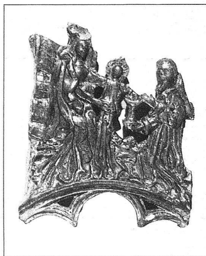
Abb. 1 und 2. Luzern. Kramgasse 9. Blattkachelnfragment eines Ofens, erste Hälfte 16. Jh., gefunden im Bauschutt. Thematisch bereits der Renaissance zugehörig sind die Motive mit Wilden Leuten, Faunen usw. – Fragment einer Kranzkachel, erste Hälfte 16. Jh., mit einer Darstellung der Epiphanie. Die modelgeformten Kacheln zeichnen sich nicht nur durch künstlerische Qualität, sondern auch durch eine ausserordentlich sorgfältige handwerkliche Fertigung aus