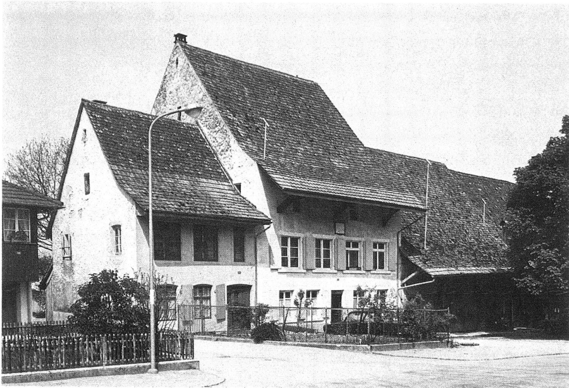
Itingen BL. Die Häuser Nr. 33 und Nr. 35 vor der Restaurierung mit den Profilen des geplanten Neubaus auf den Dächern. Der untere Teil des Scheunendaches droht zusammenzubrechen. Mit dem Neubau wäre die Lücke zwischen Nr. 31 und 33 durch die Verbreiterung der Seitenstrasse grösser geworden