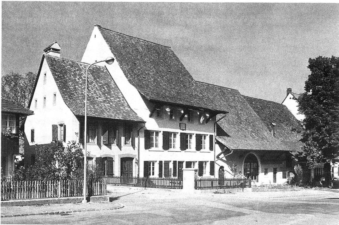
Itingen. Die Häuser Nr. 33 und Nr. 35 nach der Restaurierung. Die in der Scheune eingebaute Wohnung ist vor allem auf die Rückseite orientiert, so dass an der Scheune ausser der Belichtung durch das Scheunentor nichts verändert werden musste