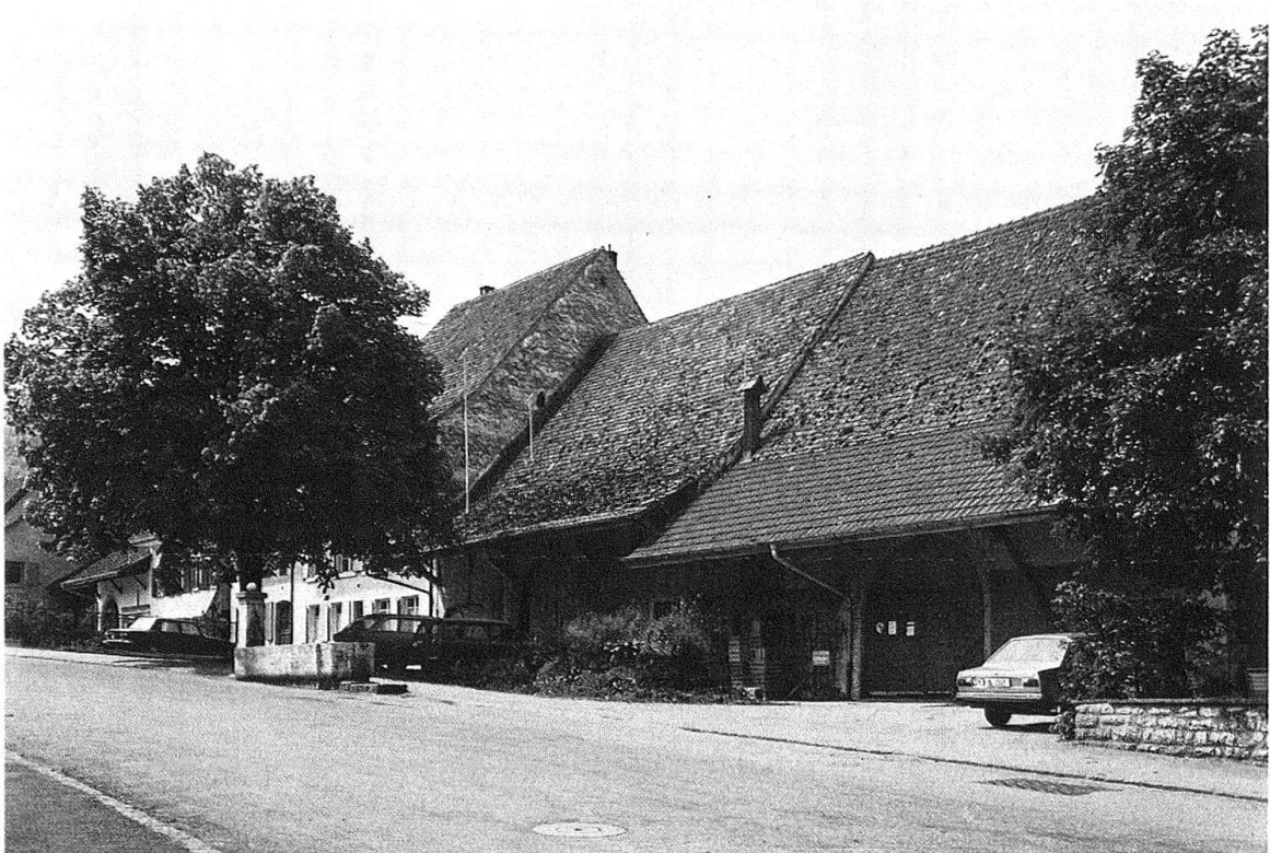
Itingen. Blick auf das hohe Wohnhaus Nr. 35 und die Scheune mit den Profilen des vorgesehenen Neubaus auf den Dächern. Daran angebaut die Scheune Nr. 37