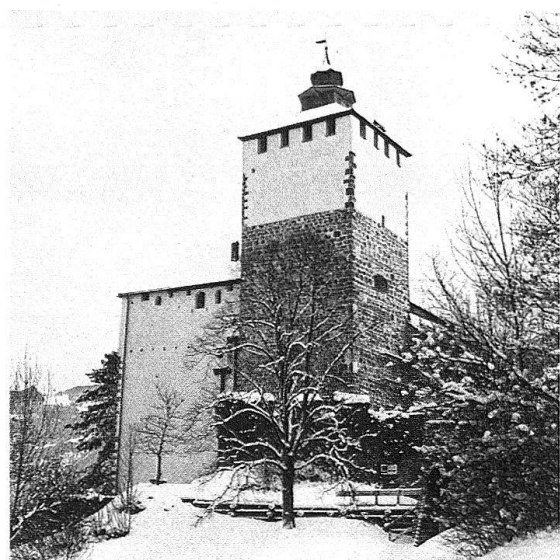
Die trutzige Nordwestseite des Schlosses Werdenberg vor und nach der Restauration im Sommer 1977