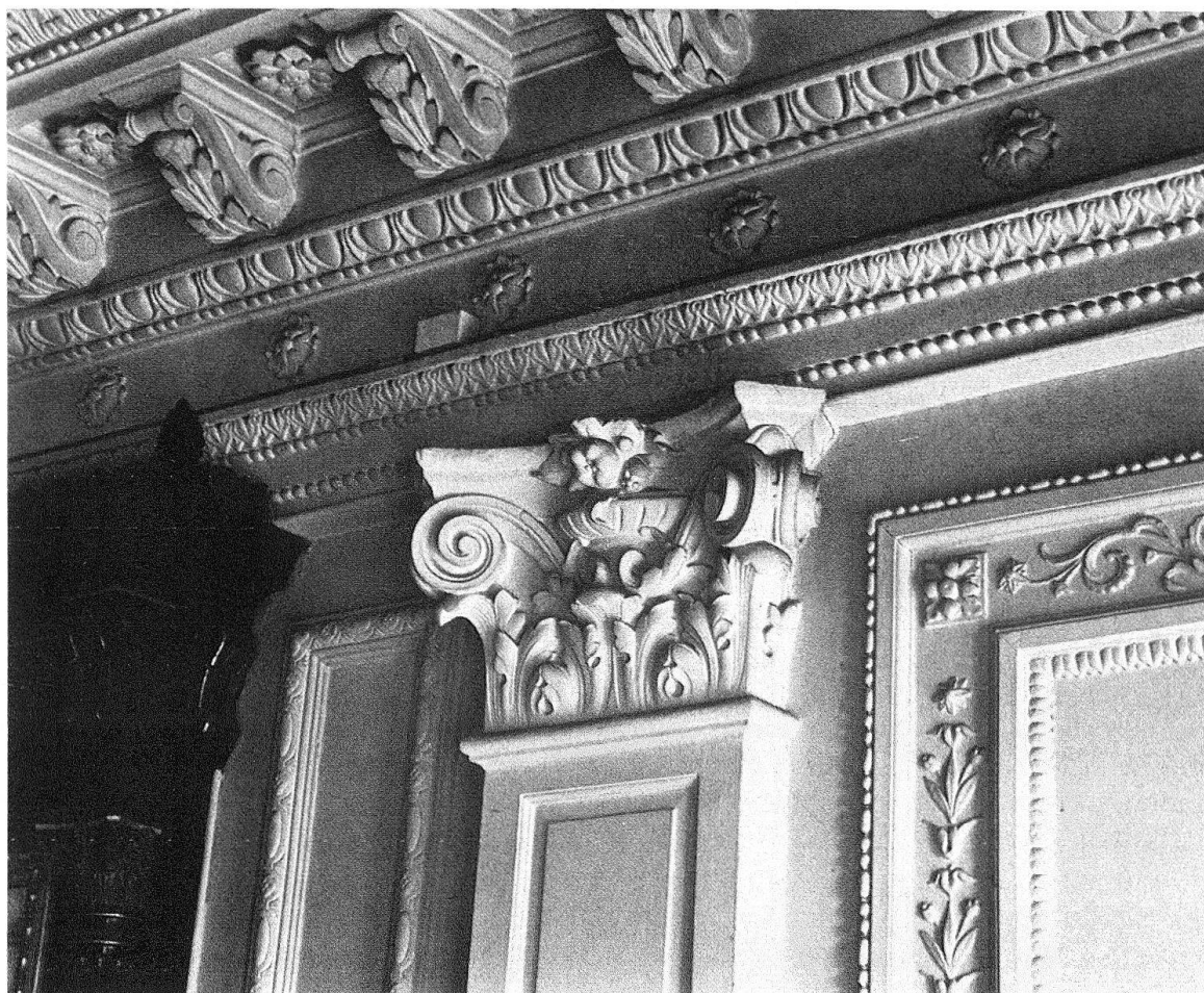
St. Gallen. «Helvetia». Wand- und Deckengestaltung des Sitzungszimmers des Verwaltungsrates im Erdgeschoss

so einig wie in diesem Falle! Es sei technisch nichts mehr zu helfen ... dabei haben wir schon etliche Objekte ähnlich schlechten oder noch schlechteren Zustandes retten können ... erwähnen wir nur die laufende Restaurierung der Haupthalle des Zürcher Hauptbahnhofes. Und dann: die Umgebung der «Helvetia» habe man architektonisch schon so abgebaut, und durch Neubauten verdorben (so!), dass die «Helvetia» in dieser Gesellschaft zu keiner baukünstlerischen und städtebaulichen Ausstrahlung mehr gelange. Nun, das ist wahr: man hat dem Quartier durch den Abbruch des alten Bahnhofes von 1855/56 und erst kürzlich noch des 1885–1887 von Hirsbrunner und Baumgartner errichteten Rathauses übel mitgespielt. Jetzt ist der «alte Sandhaufen Helvetia» beseitigt. Soll nun aber das Spielchen mit dem St. Galler Abreisskalender in Richtung Bahnhof einfach weitergehen? Was soll mit den Bauten geschehen, die immerhin mit glanzvollen Namen wie Pflughard und Haefeli oder Curjel und Moser verbunden sind? Das Bahnhofgebäude – A. von Seenger, 1911–1914 – und die Post – Pflughard und Haefeli, 1910–1914 – zählen zu den hervorragendsten Verkehrsbauten in weiter Runde. Soll man weiter sündigen, weil das durchlöchernte Quartier an denkmalpflegerischem Gewicht verloren hat und die noch bis vor kurzem vorhandene Schwerpunktbildung in Frage gestellt ist?