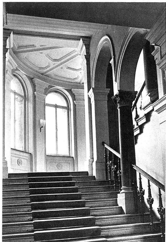
St. Gallen. «Helvetia». Eckrisalit des Westtraktes und Treppenhaus vom Erdgeschoss zum 1. Obergeschoss