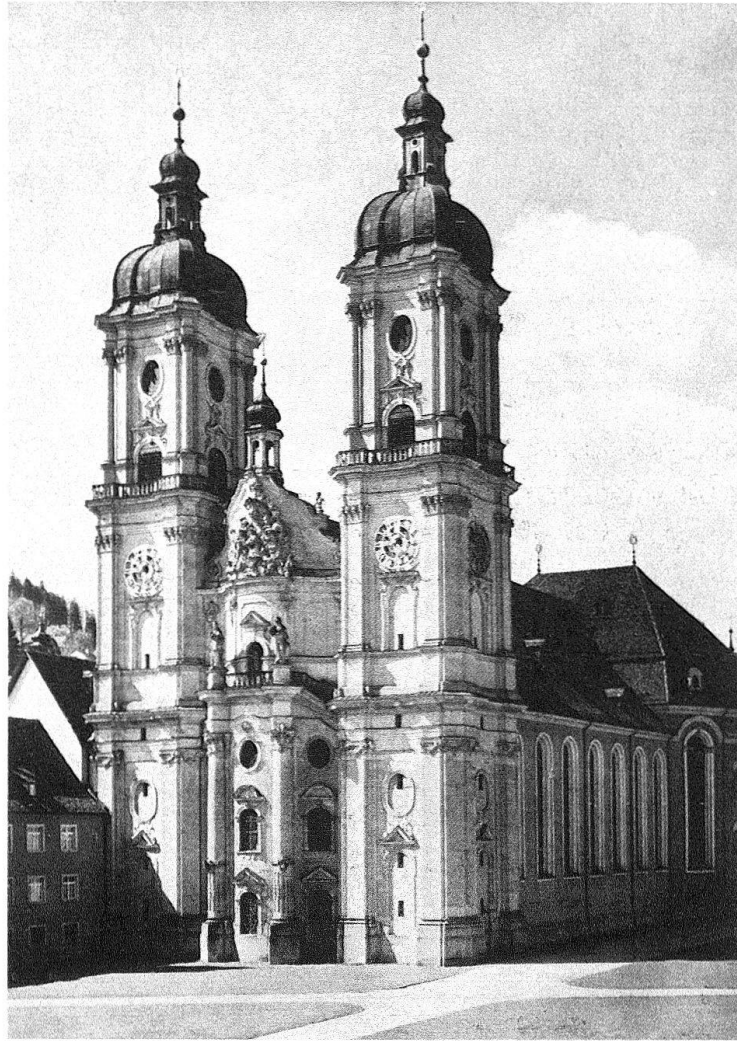
St. Gallen. Die Kathedrale – Wahrzeichen der Stadt; 1967 nach umfassender Innenrestaurierung der Bevölkerung zurückgegeben. In ihrer Nähe werden nun restauriert: der Zeughausflügel und die St.-Laurenzen-Kirche