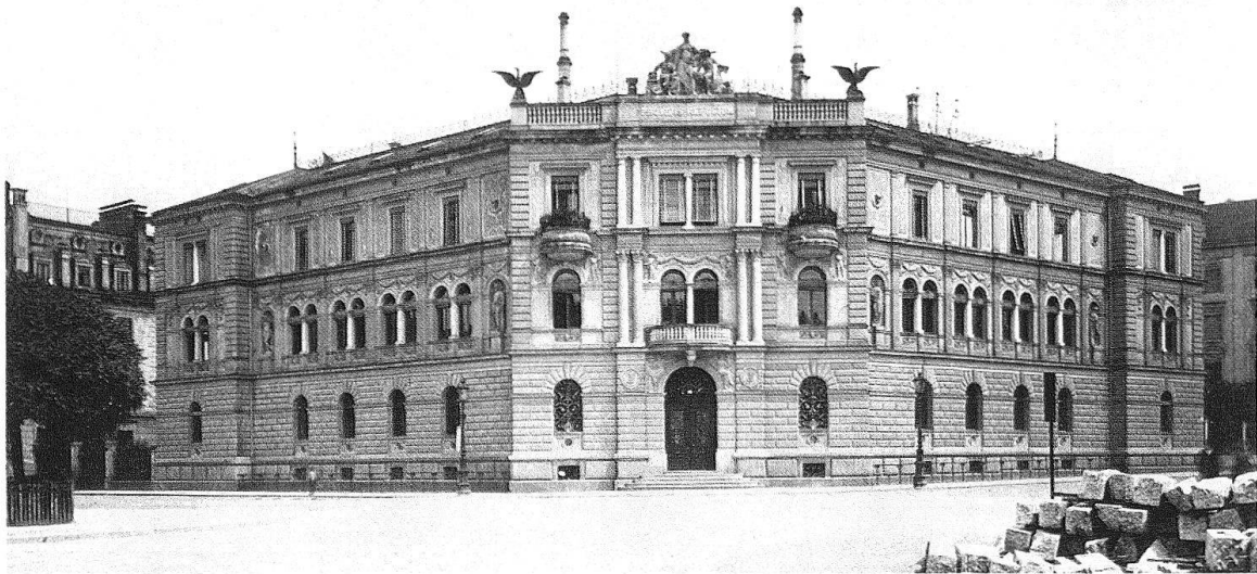
St. Gallen. «Helvetia», Leonhardstrasse 25. Zustand mit Malereien im 2. Obergeschoss, Kaminen, Eisengittern der Dachterrasse, altem Portal und Fenstergittern im Erdgeschoss. Aufnahme um 1905